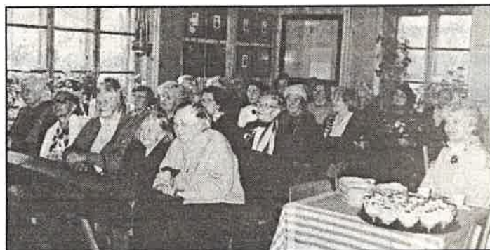
V.-M. Täienduskooli vilistlaste kokkutulekust osavõtjad laste kontserdi kuulamas.

endine Väike-Maarja Täienduskooli õpilane