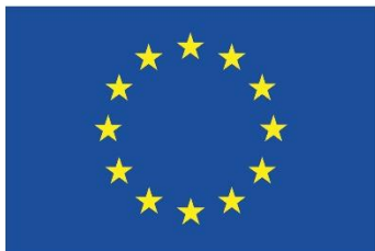
Euroopa Liit Euroopa Regionaalarengu Fond