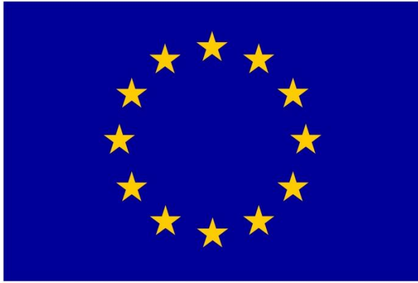
Euroopa Liit Ühtekuuluvusfond