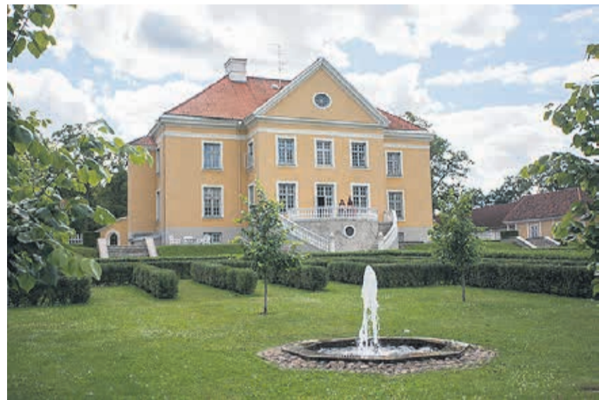
Palmse mõis on Eesti üks paremini ja terviklikumalt restaureeritud mõisaid.

1766. a avanes piiritusele Venemaa turg – see sai mõisnikele peamiseks tu-