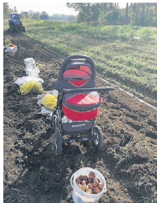
Väike Miagi oli tänava kartulipõllul abis.

Ega lapsed millestki ilma ei jäänud. Raha oli küll vähe, aga ostsidki lastele. Meil on aegu, kus on hunnikutes võimalik komme osta ja on ka nii, et lapsed ei tahagi enam kommi. Neile meeldib praetud pekk ja krõbe seakamar – maatoidud noh. Hommikuti näiteks mitte puder, vaid praekartul ja munapots. Soolast ikka rohkem, kui magusat. Neil võivad mitu nädalat kommid seista.