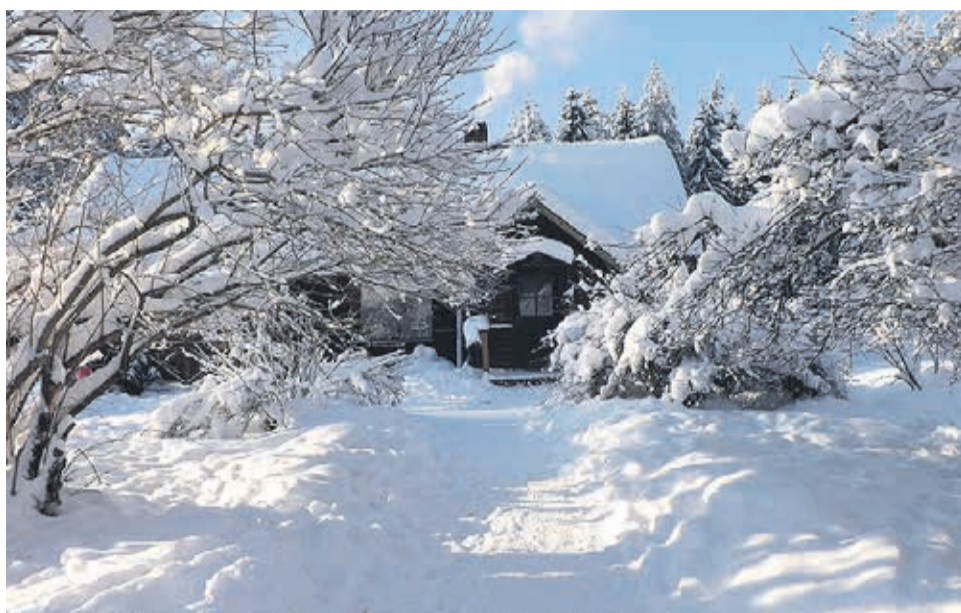
Minu kodu.

Olen sündinud Eestimaal, meeldib väga mulle see maa. Kui oleksin sündinud Soomes või Poolas, meeldiks sünnimaa sellegipoolest. Vahet pole, kus elan ma,