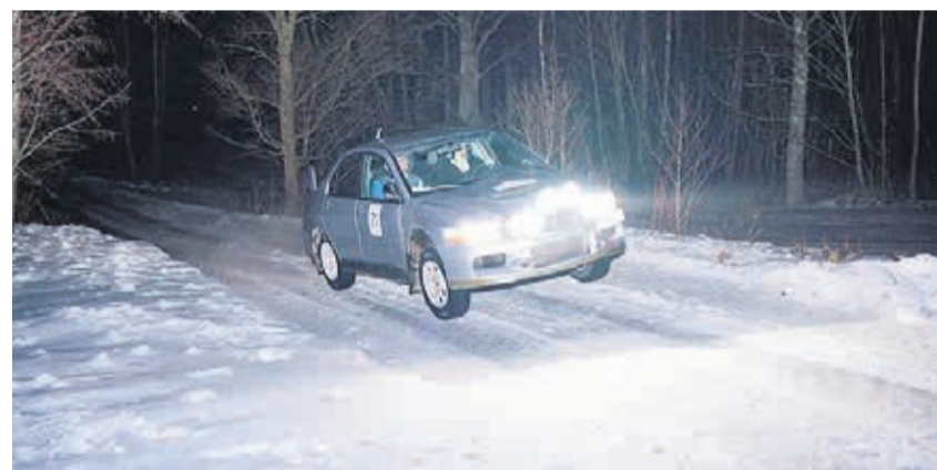
Nr 21 rajal kihutamas.

Ralli tehniline ülevaatus oli korraldatud seekord mõnusalt katuse all ning alates varastest hommikutundidest (kella 6.00) pidid kõik rallist osavõtjad selle läbima.