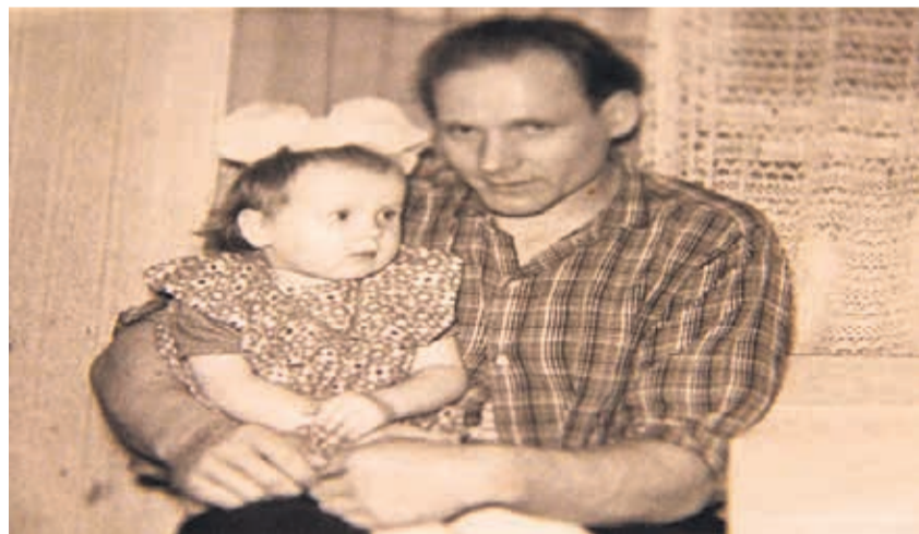
Sirje oma armsa isaga.

Kui ema ja isa koos elasid, siis käisin Kundas koolis. Vanaemaga koos kolisime talveks alati Kunda- dasse elama. Ema ja isa läksid lahku,