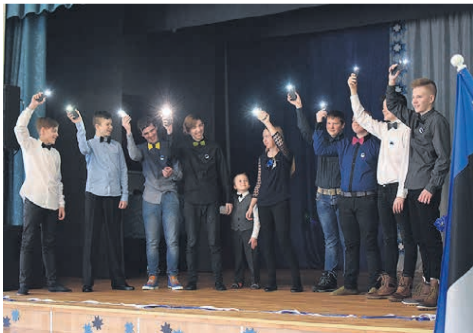
22. veebruaril tähistas kogu koolipere Eesti Vabariigi sünnipäeva.

19. veebruaril osalesid õpilased 1. – 2. klassi talvistel meistrivõistlustel Rakveres.