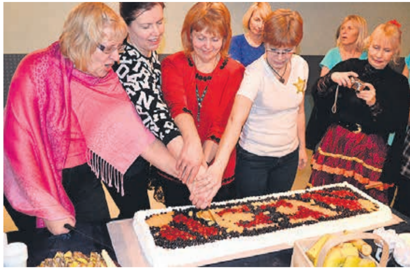
Rakke kultuurikeskuses on rivitantsu tantsitud 15 aastat.

Märtsikuu viimasel laupäeval, ehk siis 30. märtsil toimub Rakkes järje-