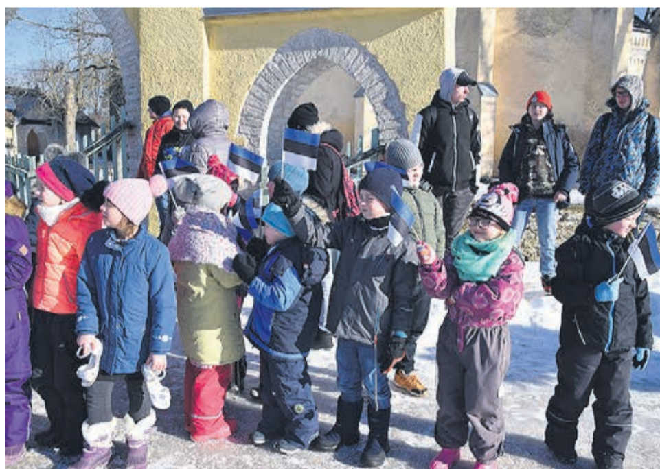
Uhkes rongkäigus.

4. – 9. klass kuulas Kerli Kõue loengut „Kuidas vähendada ökoloogilist ja-