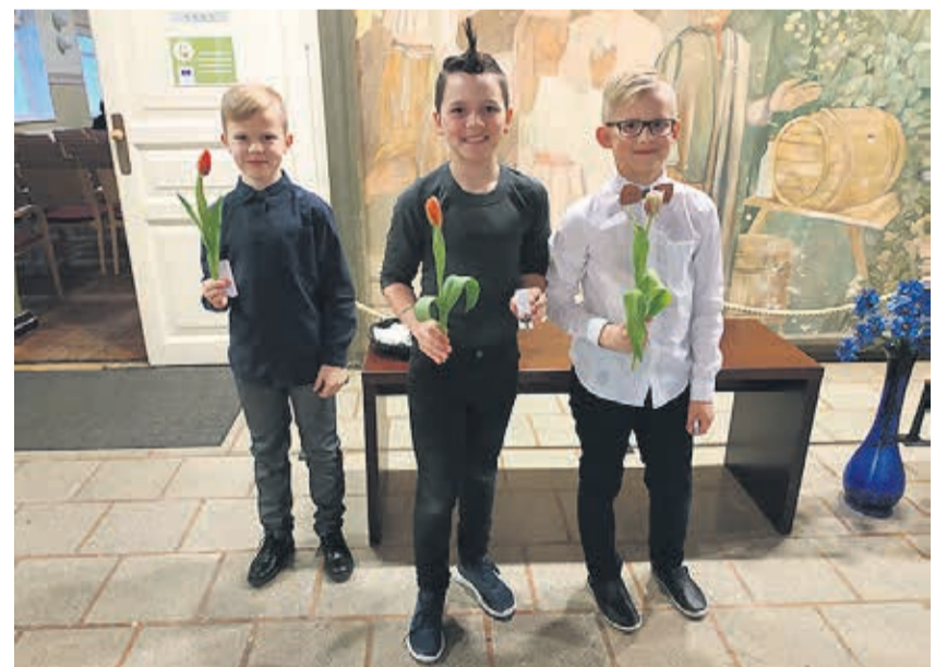
Noorhärade kingitus pani naistel silmad särama.