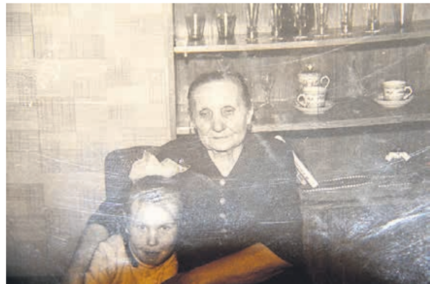
Vanaema oli Sirjele suureks eeskujuks.

lugenud – kõik võeti kampa ja kõigiga mängiti. Me mängisime rahvastepalli, kaksteist pulka, keksu, vanaisa vanad püksid, peitust, võrkpalli, korvpalli. Hommikuti läksime Kunda randa, sinna oli umbes viis kilomeetrit, kui mitte rohkem. Hommikul läksime ja õhtul tulime. Tegime teatrit, mängisime kaarte puukuuris. Hästi tore lapsepõlv oli.