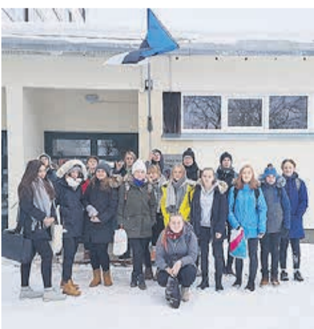
Laagri kooli 8.s klass.

Kell on umbes 8.45 ning oleme jõudnud Väike-Maarjasse. Tormame ruttu bussist välja, siseneame koolimajja ja suundume nagide juurde, paneme üleriided ära ning seejärel tutvustatakse meile koolimaja. Kuna oleme jõudnud vahetunni ajaks, on gümnaasiumi õpilased koridorides ja tulistavad meid ohtlike pilkudega, nagu me oleksime sissetungijad. Selle peale hakkab mul kõhe ja kiirustan veelgi klassi poole, et nendest põletavatest pilkudest eemale saada.