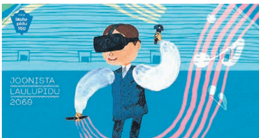
Joonistuskonkursi visuaal. Autor disainer Martin Rästa.

Konkursile saadetakse töid peab olema paberkuul, tasapinnaline ja A3 formaadis. Joonistus- või maalimistehnika on vabalt valitav.