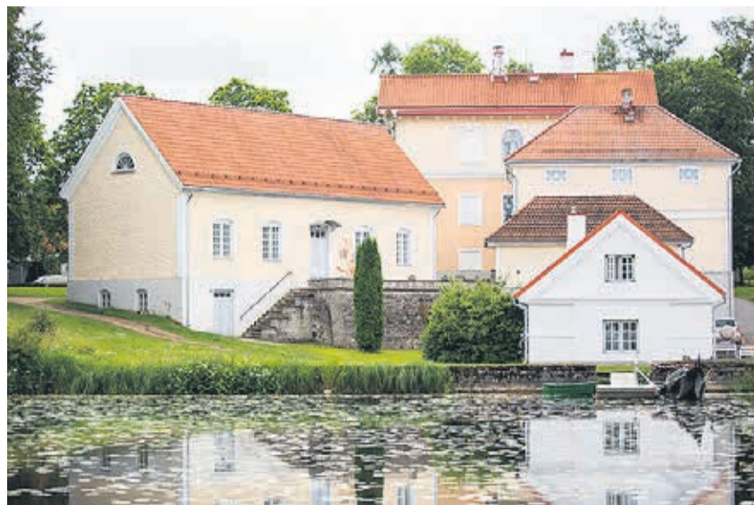
Vihula mõis.

tuntuim Pahlenite suguvõsa esindaja – Eestimaa rüütelkonna peameheks valitu, Balti raudtee seltsi president – organiseeris Peterburist Paldiskisse ühendava raudtee liini ehitust ning raudtee