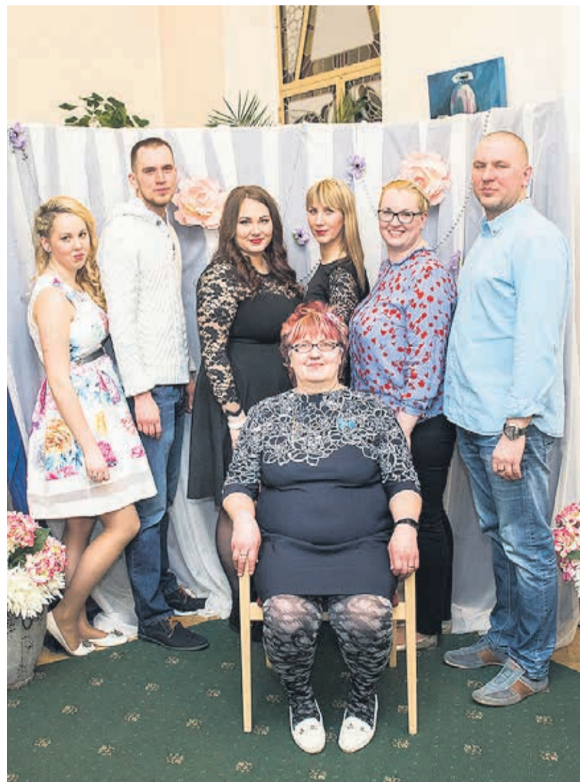
Sirje sünnipäev.

Tairi oli esimene, kes astus kodutütteks. Mina ja Taisi oleme naiskodu kaitsjad. Ma olen see inimene, kes tahab igast valdkonnast midagi teada. Muidu ju teada ei saa, kui ise kuskil ei käi või ole. Kui