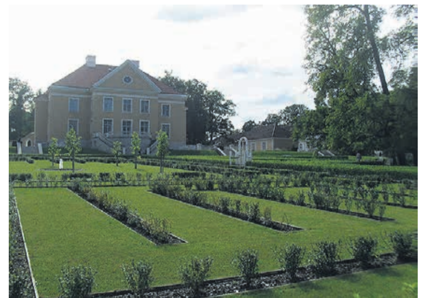
Mõisa park.

1766. a avanes piiritusele Venemaa turg – see sai mõisnikele peamiseks tu-