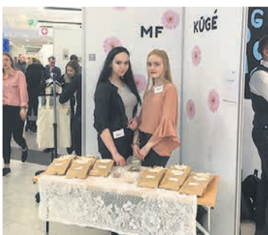
Väike-Maarja gümnaasiumi minifirma KÜGE.

eriline, et esimest korda oli informatsiooni edastamiseks kasutusel telefonirakendus Attendify, mille abil sai end kursis hoida päeva jooksul toimuvaga.