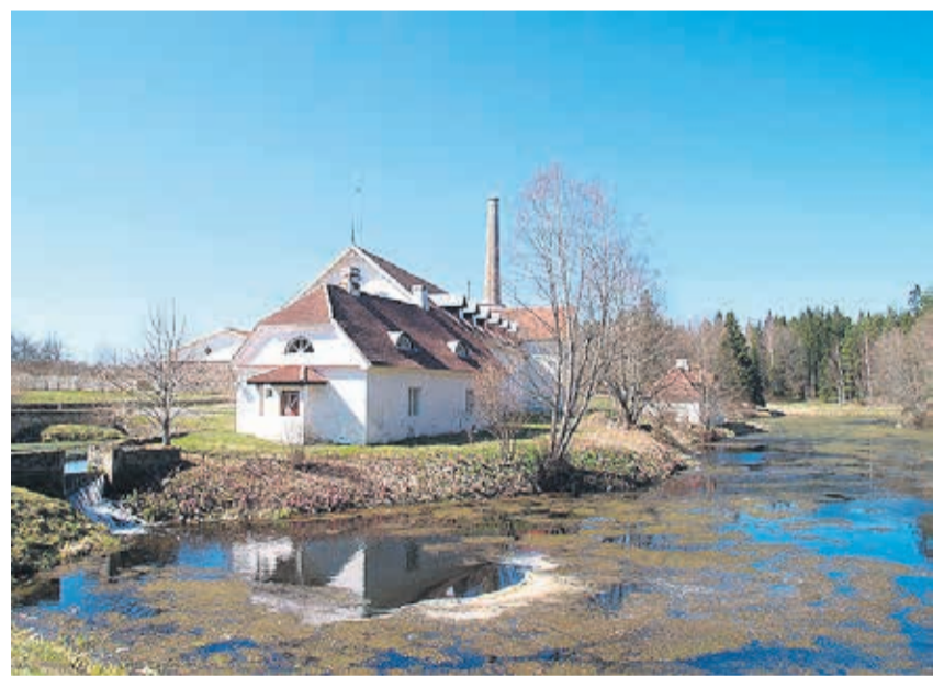
Õlleköök (ees), viinavabrik (taga) ja pesuköök (tiigi kaldal).