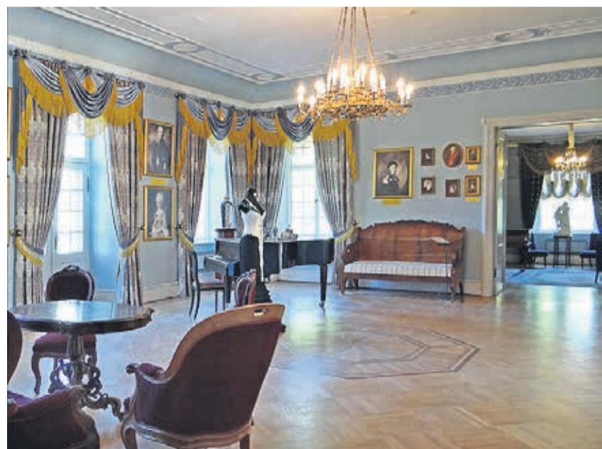
Palmse mõisa härrastemaja interjäär.