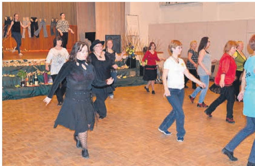
Uus tantsustiil meelitas huvilisi mitmeid, kuid püsima on jäänud vähesed.