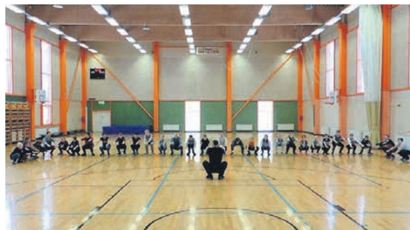
Kükkiv kool.

Üldjoontes usutakse, et õnnetundeks on vaja palju raha või mingeid erilisi vahendeid. „Jõudsin lõpuni!“, „Sain hakkama!“, „Tegin ära!“, „Tulin toime!“ või „Pidasin vastu!“ – neid emotsioone soovib tunda iga inimene. Tegelikult on kordaminekutest tulenev hea tunne palju lähemal, kui enamasti arvatakse. Sügavam sisemine rahulolemine on võimalik saavutada juba väga käepäraste vahenditega, aga enne tuleb inimolend ka vastavalt mõtlema suunata. Tõeliselt rikas ja õnnelik ongi see, kes oskab rõõmu leida lihtsatest asjadest (tegemistest). Ent see on suur oskus, mida tuleb paljudel õppida. Aga, kui see võime tekib, siis ei ole enam kunagi igav või probleeme motivatsiooniga. Meie elu sisukus sõltub suurel määral võimest avastada. Uurida võib igasuguseid asju, tervet maailma enda ümber, kuid teekond tõeliselt põnevate ja rahuldust pakkuvate leidudeni algab iseenda avastamisest. Pealegi, iseenda