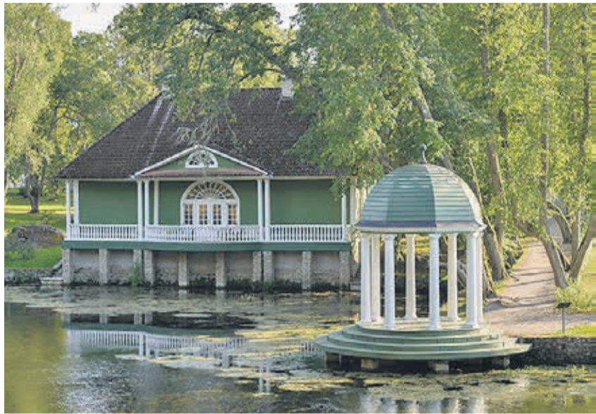
Supelmaja.