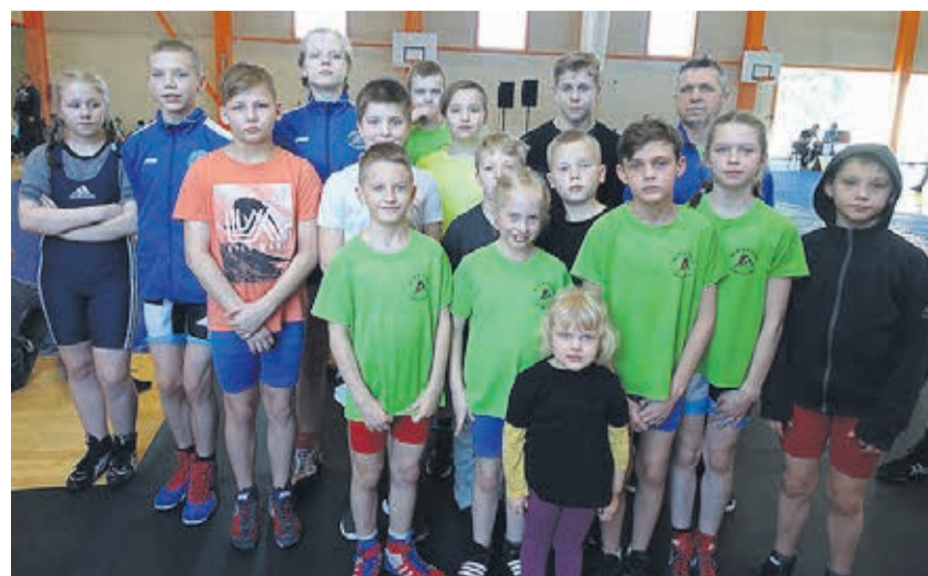
Võistlusel Nublust Nabini.