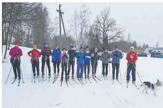
Esimene suurem kamp, kes matkale siirdus.

Rakke linnamäe suusaradasid püüan hooldada kuni lund jagub ja tehnika seda vähegi võimaldab. Kellel aga suu-