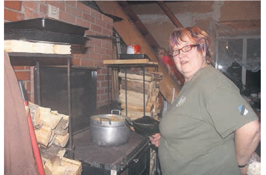
Sirje tehtud kapsad on üle valla tuntud.

gule tõmmatud ja edasi sõidetud. Traktoriga olen kurgipõllul tööd rassinud teha nii, et silm kah ei pilgu. Mis mulle