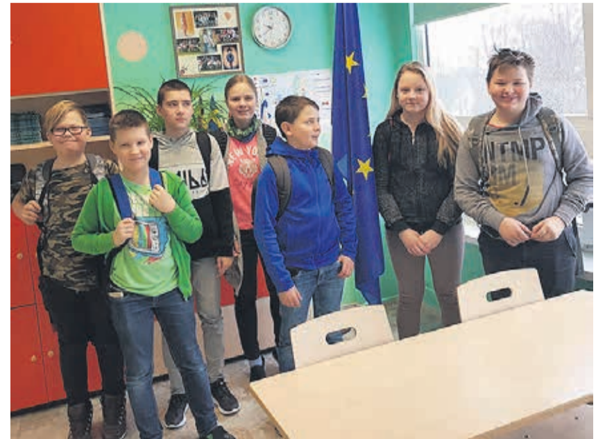
Simuna kooli V klass.

Päeva lõpetasid kehalise kasvatusetund ja ülekoolline mälumäng. Kehalise tundi erines selle poolest, et tundi andsid kaks õpetajat. Mälumäng oli samuti teistsugune kui meil. Meil toimub