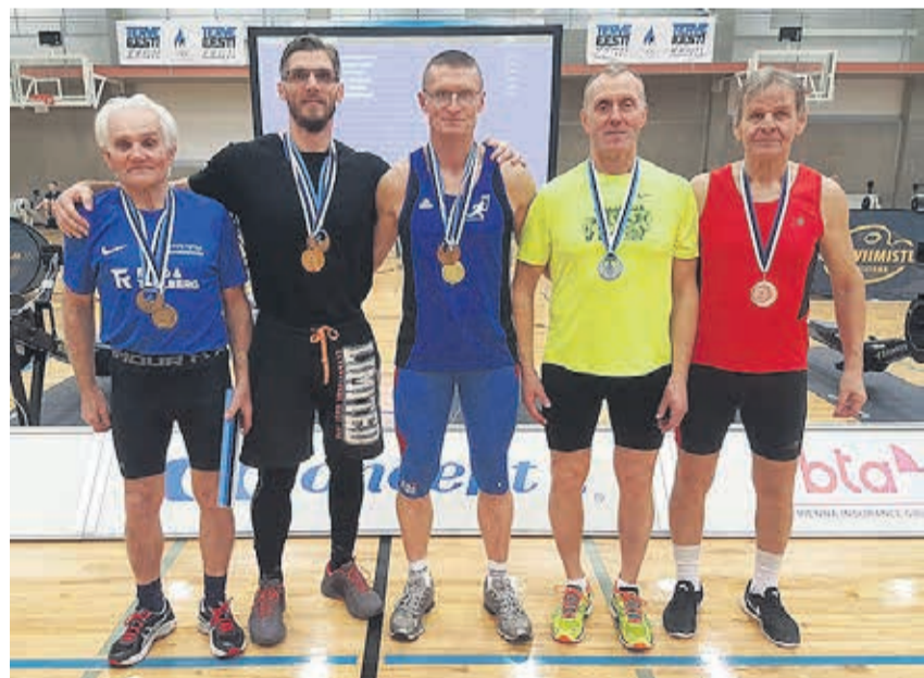
Uhkeid tulemusi saavutanud võistlejad.