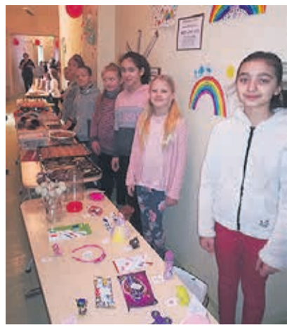
Sõbrapäeva kohvik-laad.

13. veebruari hommikuks oli algklasside pikk koridor muutunud laadaplatiks ning klassidest saanud kohvikud. Tänu õpilastele ja nende vanematele olid kohvik-laada letid väga mitmekesised ja külluslikud. Müüdi torti, pirukaid, popcorni, võtmehoidjaid, telefoniripatseid, õnneloosi jpm. Õpilased