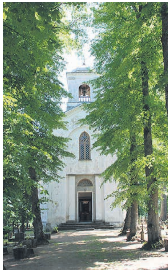
Ilumäe kirik.

Sel ajal oli seal kaubandus- töötajate laste pioneerilaager. Senine mõisa hooldaja kon- diitriivabrik „Kalev“ andis seni hallatud hooned 1973. a jõuludeks Rahvusparkile üle. Tollane juhtkond