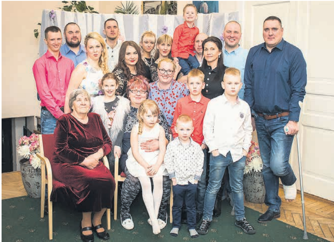
Mitu põlvkonda ühel fotol.

Minu jaoks on kõik lapsed ühesugused. Meie riigi jaoks ei ole, aga minu jaoks on. Ma olen kõik oma lapsed endale sünnitanud, mitte riigile. Pensionile võiks küll veidi varem lasta, et oleks rohkem aega lastelastega veeta. Mina ikka käega juba katsun seda pen-