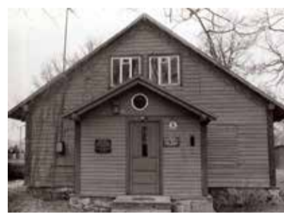
Väike-Maarja Aiandusseltsi maja. 1991.

9. juunil 1990 avati Köstri majal kaksiktahvel tekstiga „VM kiriku kõstrimaja, kus 1893-1933 elas kultuuri- ja seltsitegelane köster Johan Kotli (1853-1940). Arhitekt Alar Kotli (1904-1963) sünnikodu. “Mälestustahvli