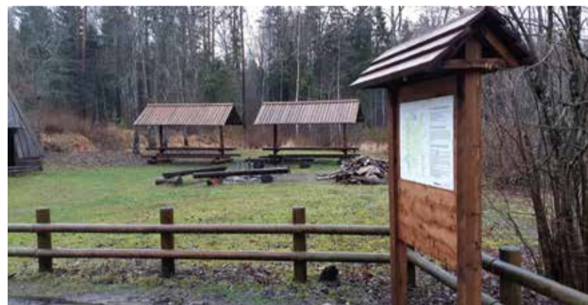
Äntu Sinijärve telkimisplats.

2019. aastal sai Väike-Maarja valla valitsus Sihtasutuselt Keskkonnainvesteeringute Keskus matkaradade hoolduseks toetust 14 593 eurot, valla osalus oli 1622 eurot.