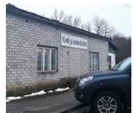
Uus postipunkt alustab tööd kooli- ja kontoritarvete kaupluses.

Paljud ei oska võibolla oodatagi, et postiteenuseid saab kasutada postkontorisse minemata, isegi kodunt lahkumata. Kõigil postiteenuse kasutajatel, kes elavad või asuvad maapiirkonnas postiasutusest kaugemal kui 5 km, on võimalus kutsuda kirjakandja koju või