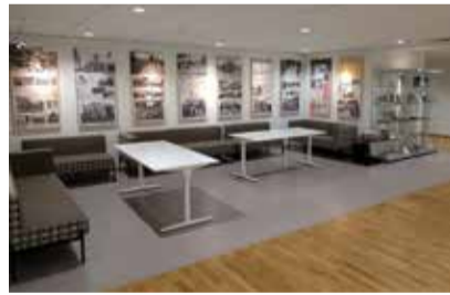
Tartu Ülikooli raamatukogu võõrustab 7. veebruarini näitust Vana aja Kiltsi ja Kiltsi kirjamehed.

- 1974. aastal kaardistasid ülikooli geograafiatudengid Kiltsi lossi lähimüürist.