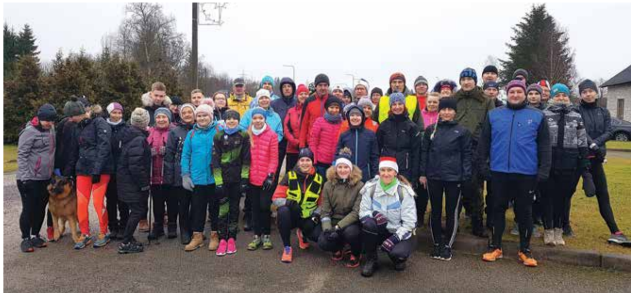
Poolasada matkaselli nautisid pühade ajal liikumist.