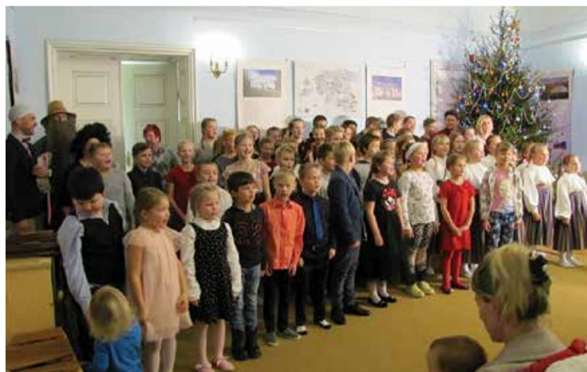
Kiltsi koolipere.

Õpetajatessse mahtus nii palju ideid ja energiat, et enamus lapsi said