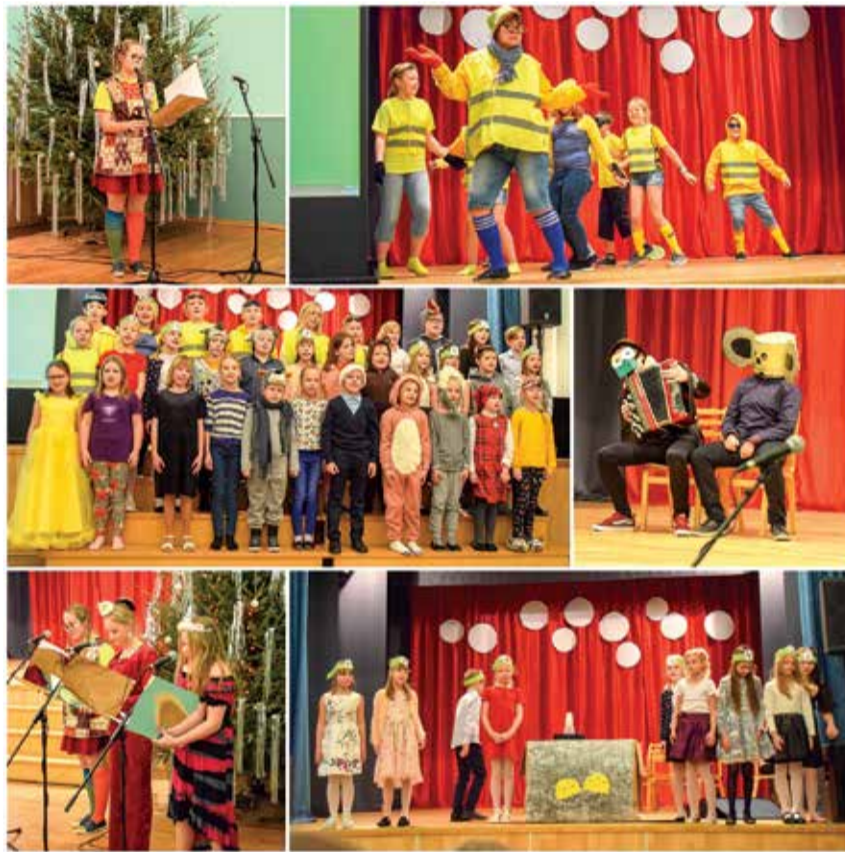
Simuna kooli jõulupidu.

enda kunagisi õpilasi nägema ja paraku ka kuulma. No see jama, mida nad seal suust välja ajasid, ei ole ka teips mitte koolimaja seinte vahel külge jäänud.