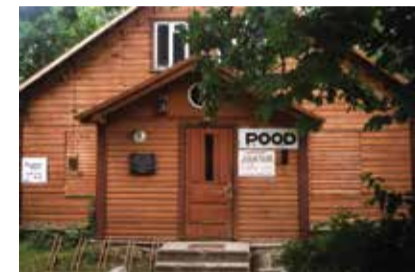
Väike-Maarja kirikule kuuluv maja. Mälestusplaat Kotlitele, sildid: Pood. Juuksur. Kasutatud rõivad. 1999.

1990. aastatest kuni maja müümiseni 2019. aastal tegutses majas juuksur, oli kasutatud riiete pood, hiljem ka tööstuskaupade kauplus. F 5