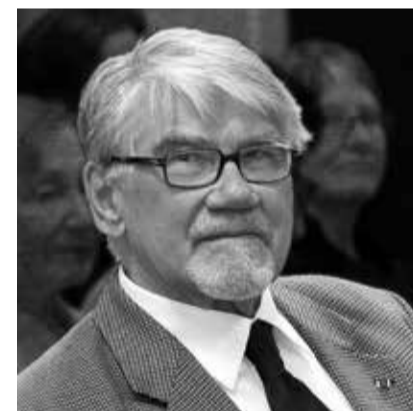
Mati Hint.

1988. aastal astus Hint poliitikasse. Ta oli üks Rahvarinde asutajaliige. Riigikogu liige oli Hint aastatel 1992-1995. Ta oli üks keeleteaduse algatajatest ja koostajatest.