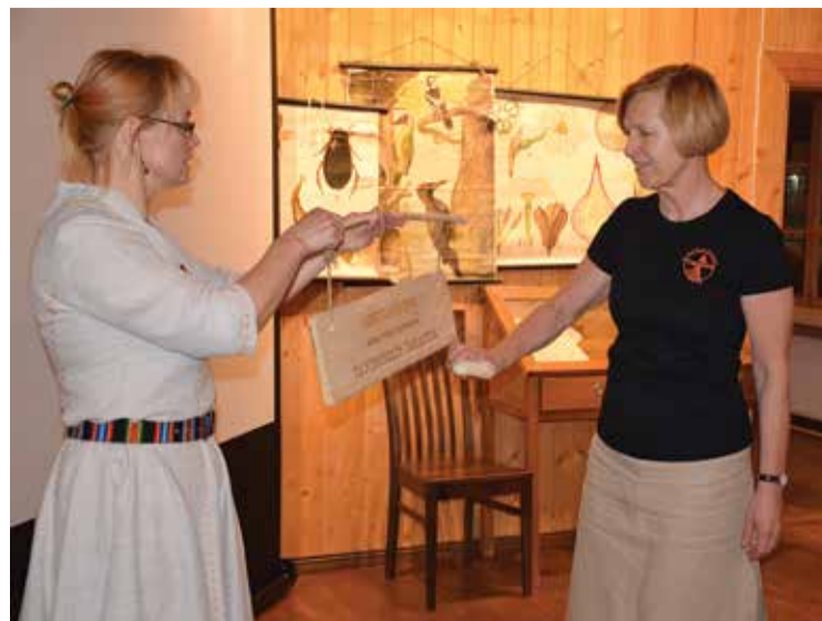
Auhinnatud videos osalejad lokulaua löömas.