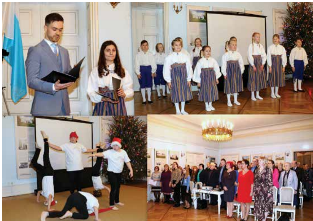
Pildinoppeid aastapäevapeost.

Väike-Maarja vald tähistas laupäeval, 14. detsembril 28. aastapäeva sellele pühendatud kontsertaktusega Kilti mõisas. Esinesid Kilti kooli lapsed, tunnustati valla kaunimaid kodusid ja ettevõtteid ning videokonkursi „Vaimu ja väega Väike-Maarja vald“ parimaid ning anti tänukirju.