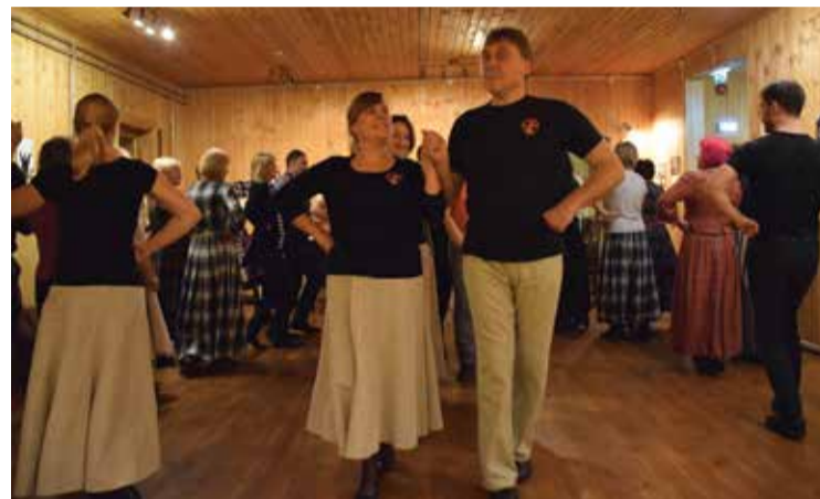
Tantsuga jõule ära saatmas.