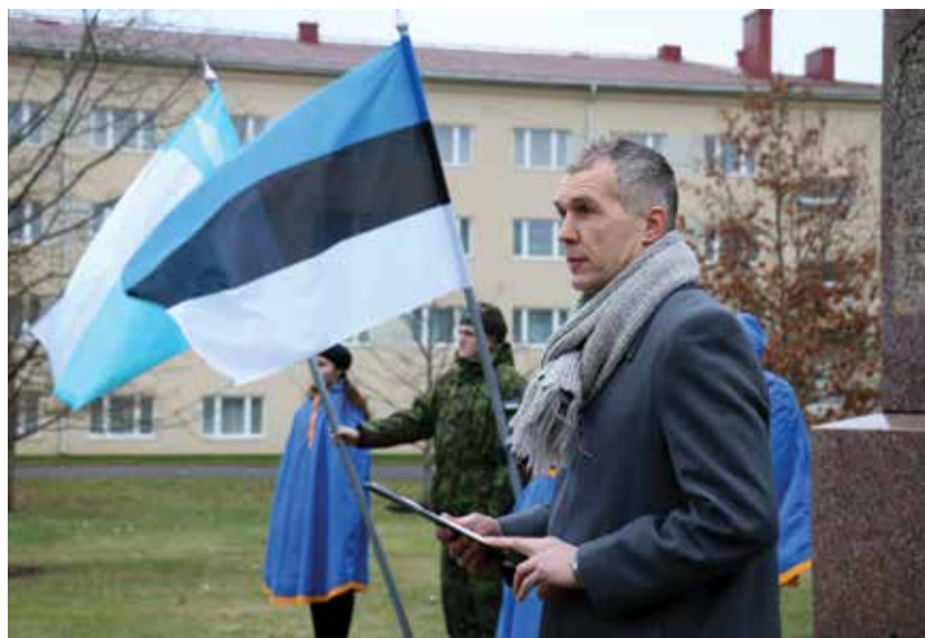
Vallavanem Vabadussõjas võidelnute mälestuspäeval kõnet pidamas.

Kindlasti on kritiseerida oluliselt lihtsam, kui reaalseid mõju avaldavaid lahendusi pakkuda. Meie valla kodulehel saab lugeda, et Keskkonnainvesteeringute Keskus hakkab vastu võtma 17. jaanuaril taotlusi, et igale elektriauto ostjale vastava toetusmeetme kaudu 5000 eurot tagasi kanda. Eks see on mõeldud ikka selleks, et autodega seotud keskkonna jalajälg oleks väiksem. Samas on meie riiklikult tunnustatud teaduse populariseerija „Novaator“ kodulehel Saksa teadlaste elektriauto kasulikkust analüüsinud uuring, mille juhtivautor Hinrich Helms võtab kokku sõnadega: „Elektriautosid pole mõtet taevani kiita. Neil on omad probleemid ja puudused. Suurt pilti vaadates pole meil vähemalt põhjust karta, et need