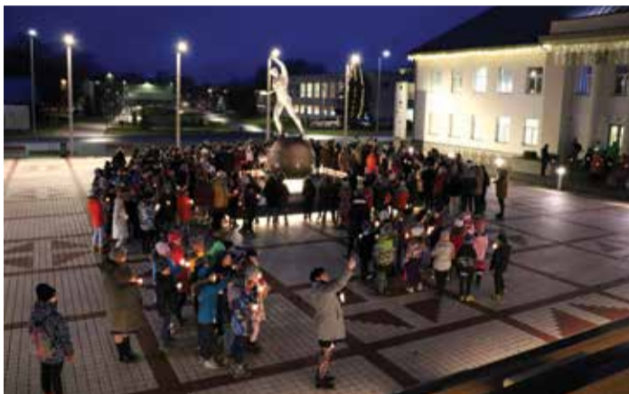
Küünaldega ümbritseti Lurichi kuju keskväljakul.