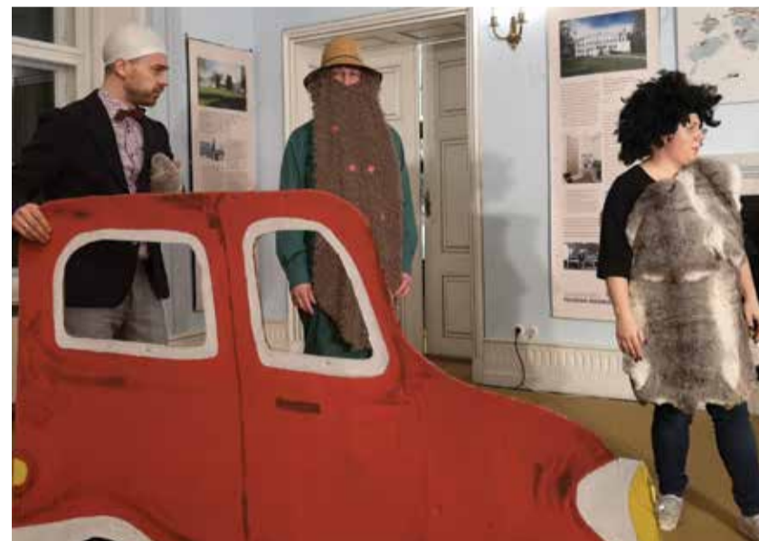
Dünaamiline trio: Muhv, Kingpool ja Sammalhabe.