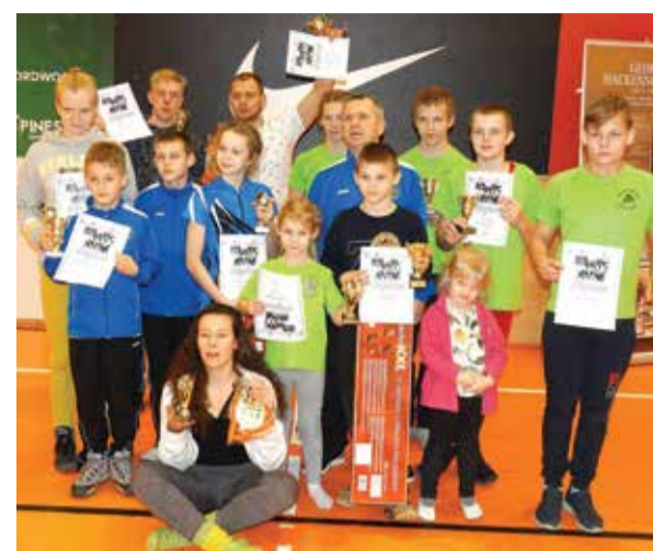
Tartus võistlusel.