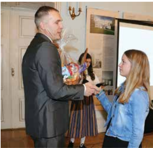
Eliise Joonas VI klassi auhinda vastu võtmas.

Teise vanusegrupi (IV-VI klass) parimaks osutus Väike-Maarja Gümnaasiumi VI klass , õpetaja Helina Lükk.