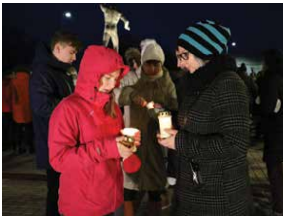
Õpilased jõuluvalgusega keskväljakut kaunistamas.