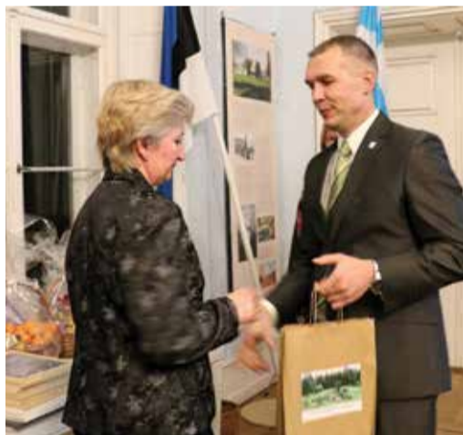
Ivaski koduaeda tunnustati liigirikka ja lähimõeldud taimevaliku ning hea kujunduse eest.

Perekond Ivaski kodu Lammaskülas - perekond Ivaski koduaed on liigirikas, väga lähimõeldud taimevalikuga ja hea kujundusega koduaed. Rohked põõsaste ja lilledega istutusala vahelduvad hooldatud muruga. Selles aias on leitud koht nii rododendronitele kui ka jõhvikatele. Iluaiaast välja jääb ka liigirikas ilupuude ja -põõsaste haljasala.