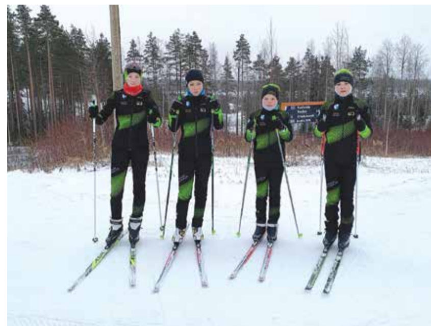
Suusaklubi õpilased Soomes laagris.