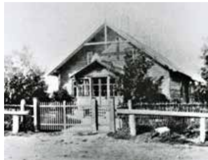
Köstri maja. 1920. a-d.