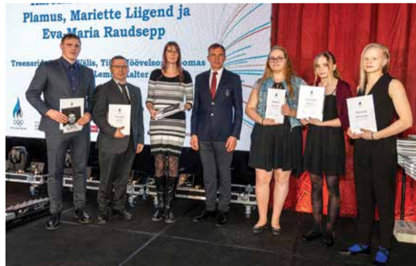
Olümpiakomitee vastuvõtul.