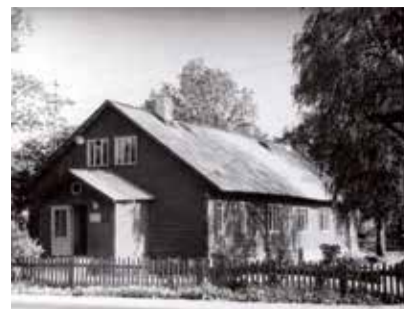
Väike-Maarja Lasteaia I, II rühma maja. 1971. Foto E. Leppik

Seoses nõukogude korra kehtestamisega natsionaliseeriti hoone, läks