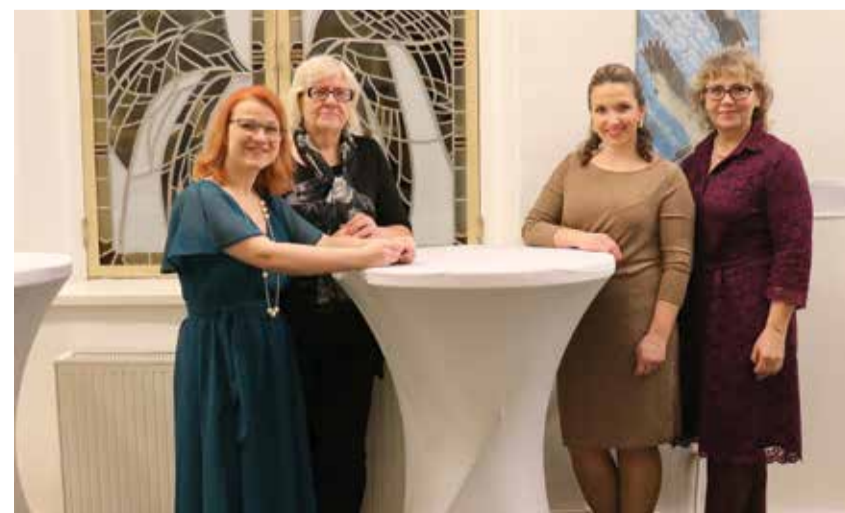
Külalised hindasid pidu suurejooneliseks.