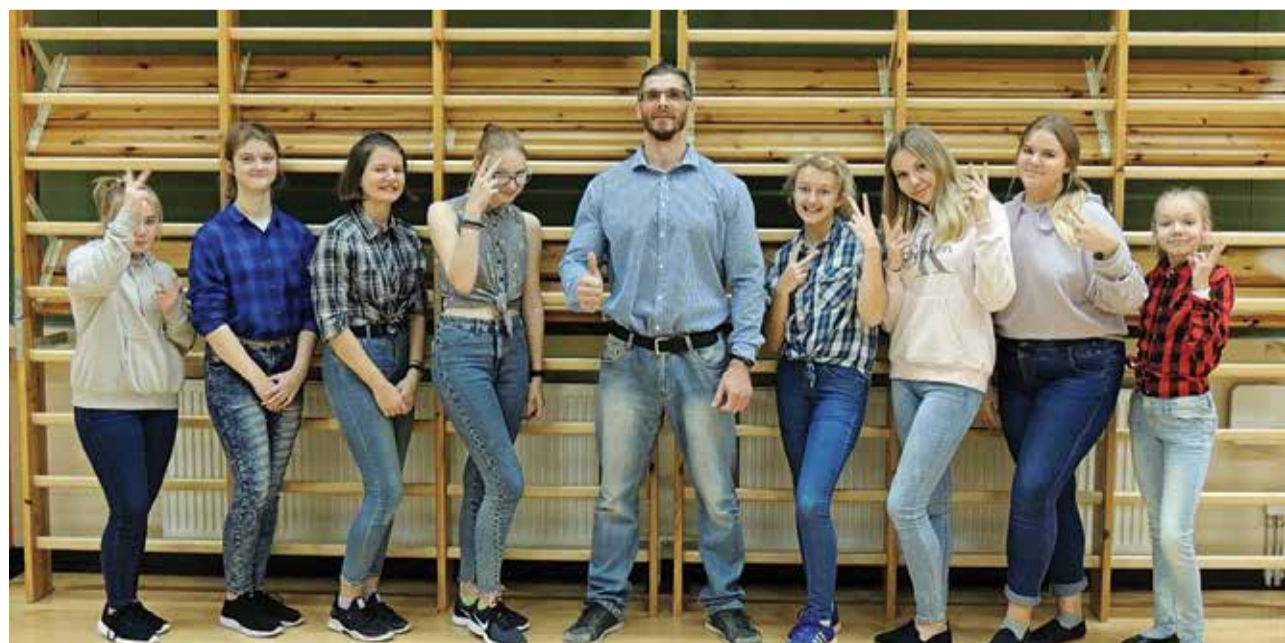
Ringi juhendaja (keskel) oma õpilastega.