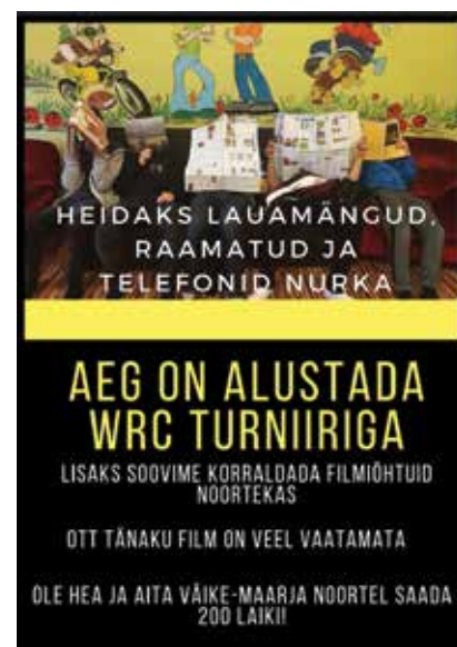
Projektikonkursi Nopi Üles plakat. Autor Madis Kaljula

Piljarditurniiril olid Rakkes taas kohal poisid, kes naljalt võistlusi vahele ei jätta. Tase oli ühtlane ja 3.-4. koha määras omavaheline mäng ning 5.-7. koha väljaselgitamiseks tuli appi võtta võidetud-kaotatud geimid ja omavahelised mängud. Paremad olid: I koht Jan