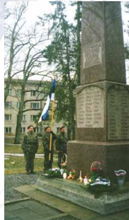
23.02.1995 Väike-Maarja Vabadussamba juures. Kaitseväe auvalve.