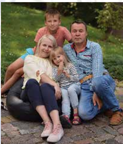
Liivika perega.

pärast on mul väga hea meel, et saan elada ja tegutseda siin, kus on minu juured. Küllap just seetõttu olen val- mis kaasa mõtlema ja panustama sel- lesse, et nii minul endal, minu perel, kui ka meie külalistel, oleks siin hea ja huvitav olla ning põhjust ikka ja jälle tagasi tulla.