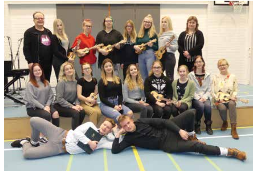
Koolinoored Hausjärvit külastamas.

Johanna Jeta Rauhala Väike-Maarja gümnaasiumi 8.b klassi õpilane