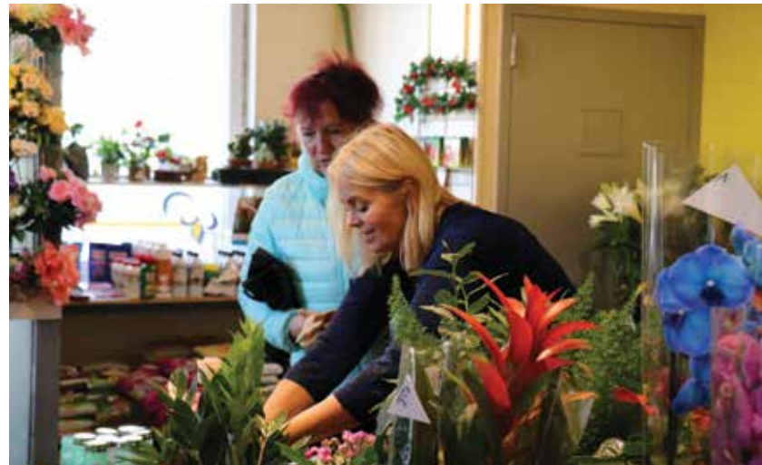
Airi klienti teenindamas.

Koos käivad sõbrannad teatris või istuvad vahel kohvikuski. Käidud on nõidade peol ja ka sporti harrastatud. „Hakkasime jooksma käima – nagu ikka noored naised – peavad olema ju saledad,“ meenutas Maime ühte seika. „Ma jooksin oma jalad nii ära – sain trauma. Ma ei taha enam mitte kunagi joosta!“, naeris ta laginal.