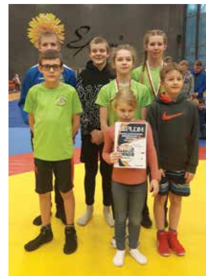
Põlvas võistlemas.