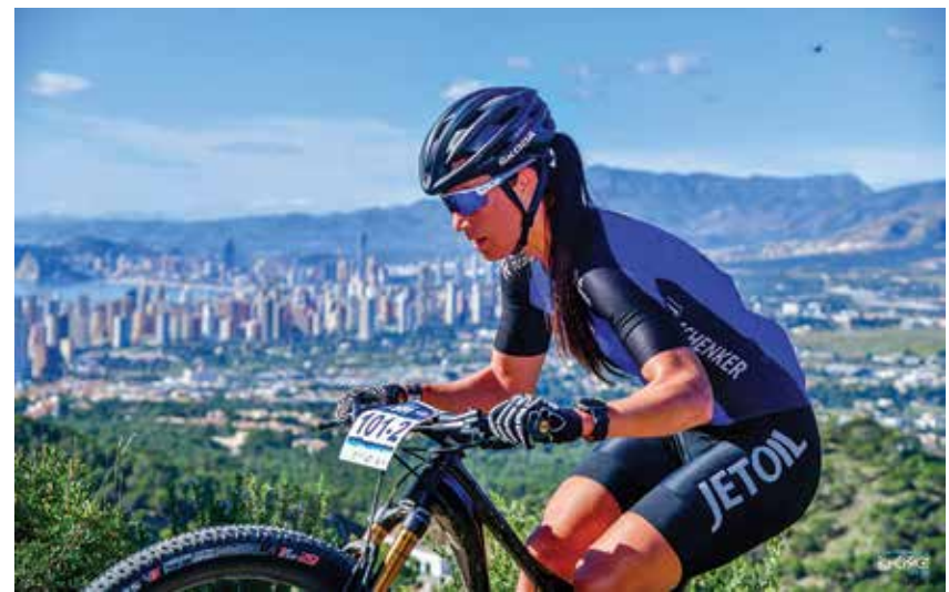
Greete Costa Blanca maastikurattatuuril.