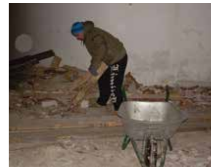
Leinamaja remontitööd on täies hoos.

Leerikool alustab märtsikuu esimesel nädalal. Ootame aktiivset osavõttu.