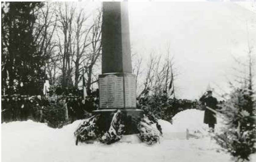
Väike-Maarja Vabadussamba austamine.