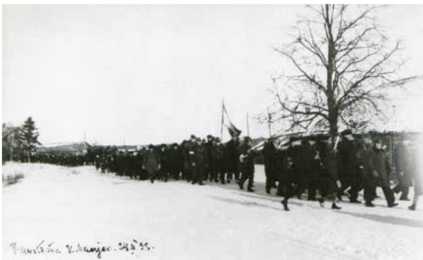
24.02.1932. Rongkäik Vabadussamba juurde.