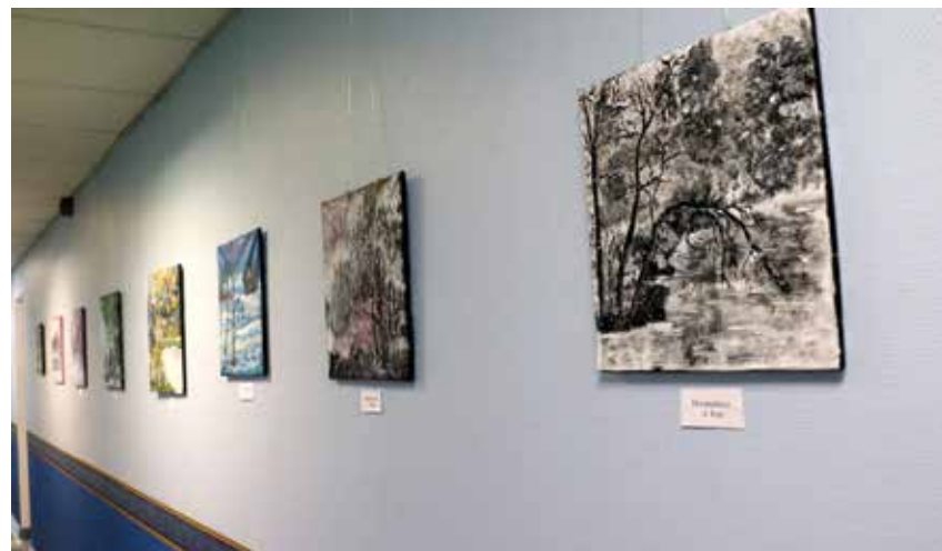
Aili Kepsi looduspildid.

Mõned viimased aastad on ta igapäevaaskelduste kõrvalt proovinud kätt käsitöökunaga. Algul erinevaid paberpunutisi tehes, siis lilli maalides ning nüüd tegeleb loodusmaalidega.