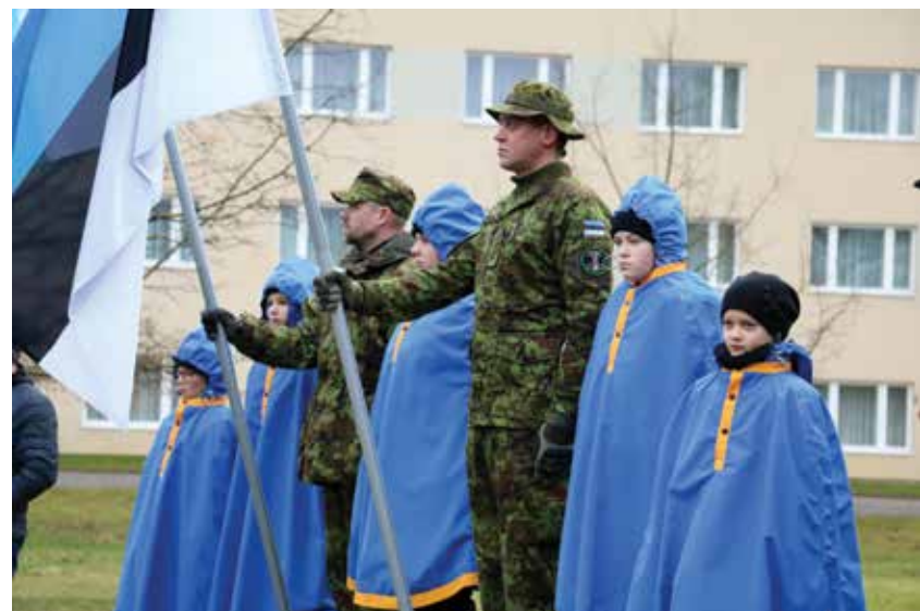
Mälestushetked Vabadussamba juures.