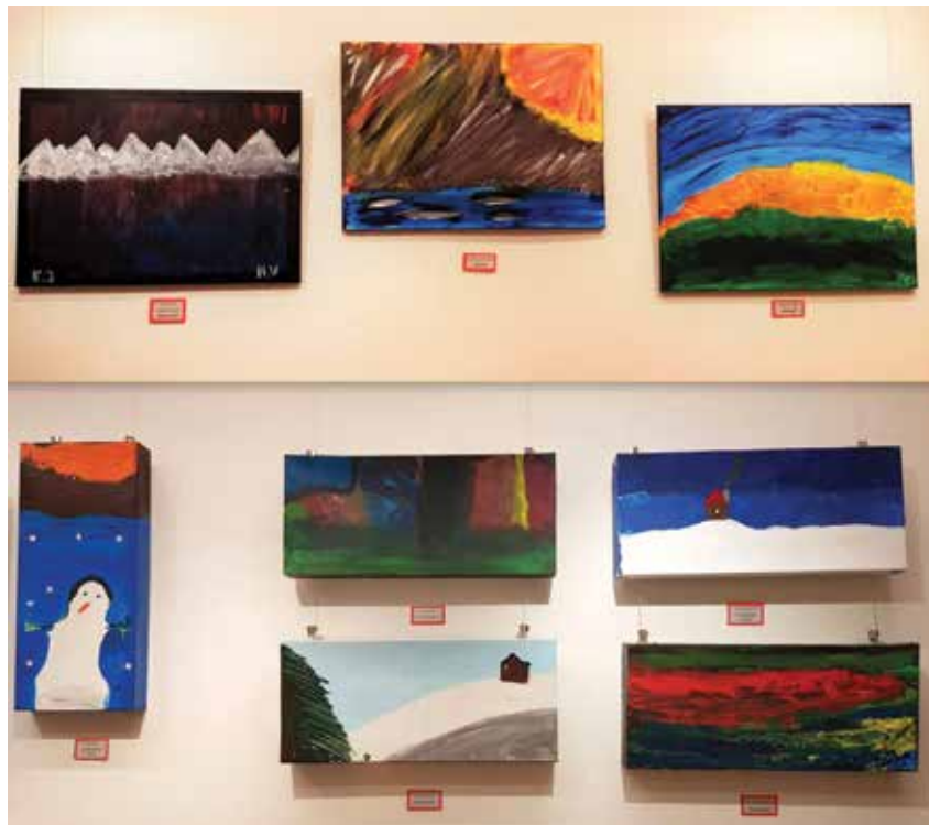
Simuna kooli kunstihuviliste poiste maalinäitus rahvamajas.

30. jaanuaril käisid seitsmendikud taas värkstoas uusi teadmisi ammutamas.