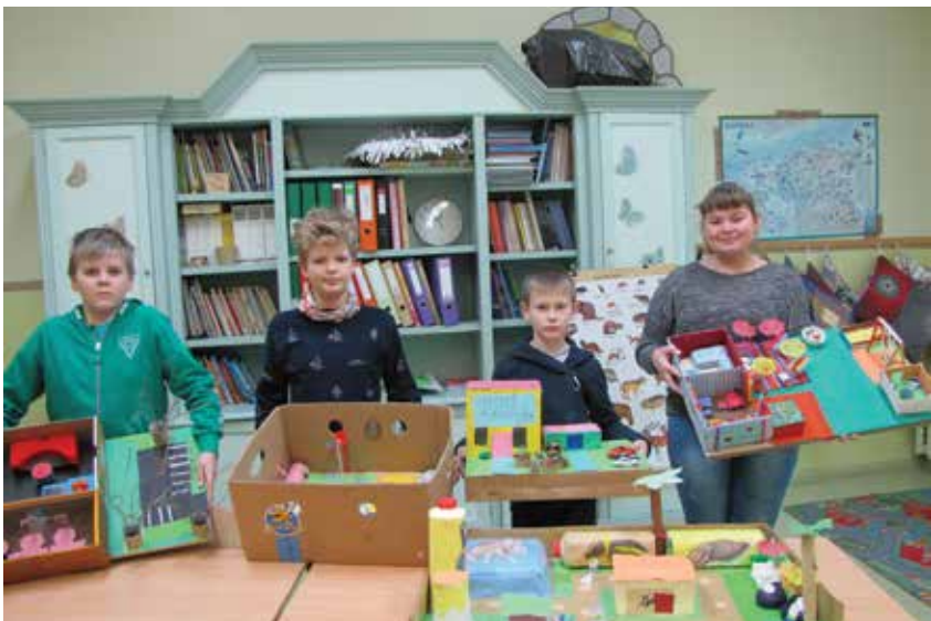
Õpilased valmistatud makettidega.

Ada Vää Kiltsi põhikooli emakeeleõpetaja