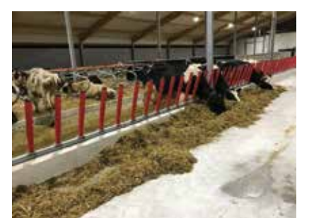
Esimesed sööjad laudakompleksis.

Hanno Tamme bibliograafia sisaldab üle 130 meediaväljaannetes avaldatud artikli või kaastöö. Aktiivse osalejana talle oluliste teemadega seotud sündmustel Väike-Maarja vallas, Murtud Rukkilille ja Memento ühingu üritustel, Eesti Vabariigi 100. aastapäevaga seotud sündmustel üle Eesti – ikka kannab ta kaaskodanikele edasi kultuuripärandit ja isamaalisust väärtustavaid mõtteid ning ärgitab seeläbi olema julgemad kodanikud ning toob vestluses alati esile mõne Väike-Maarja vallaga seotud loo või tema paljudes lugudes meie paikkonda puudutava nüansi, tuues nii tuntust Väike-Maarja vallale kui luues paikkonnast positiivset ku-