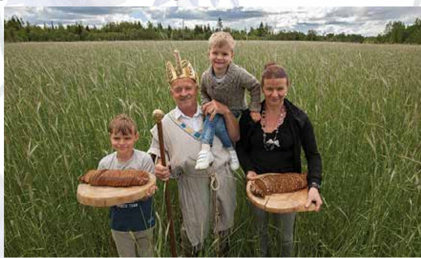
Rukkikuningas perega.

Elu läks edasi. Lapsepõlves sai mõelda laia ilma peale. Oli tunne, et ei iialgi tule tagasi siia, kus on nii palju muret, probleeme ja isegi vaenu. Mõt-