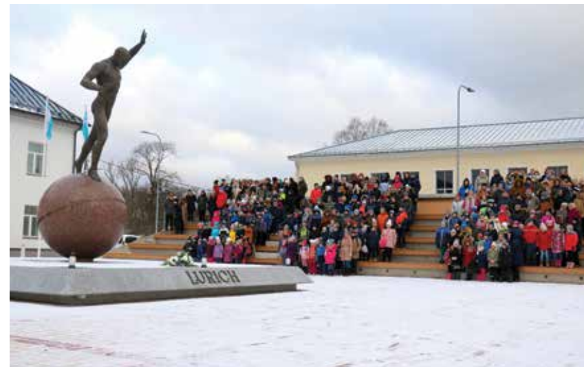
Georg Lurichi austuseks moodustati Väike-Maarja keskvaljaku tribüünile siinse gümnaasiumi õpilastest number 100.