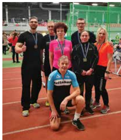
Väike-Maarja rahvaspordiklubi esindavate vaprate sisesõudjate ühisfoto.