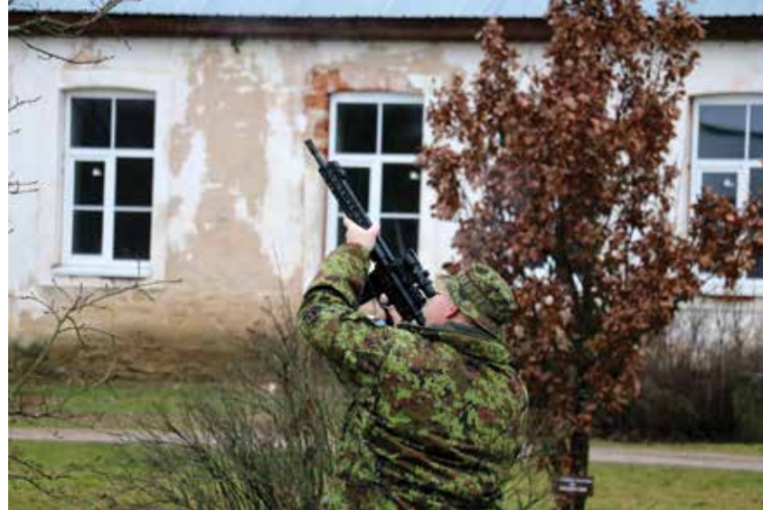
Tartu rahu aastapäeval kõlasid aupaugud.