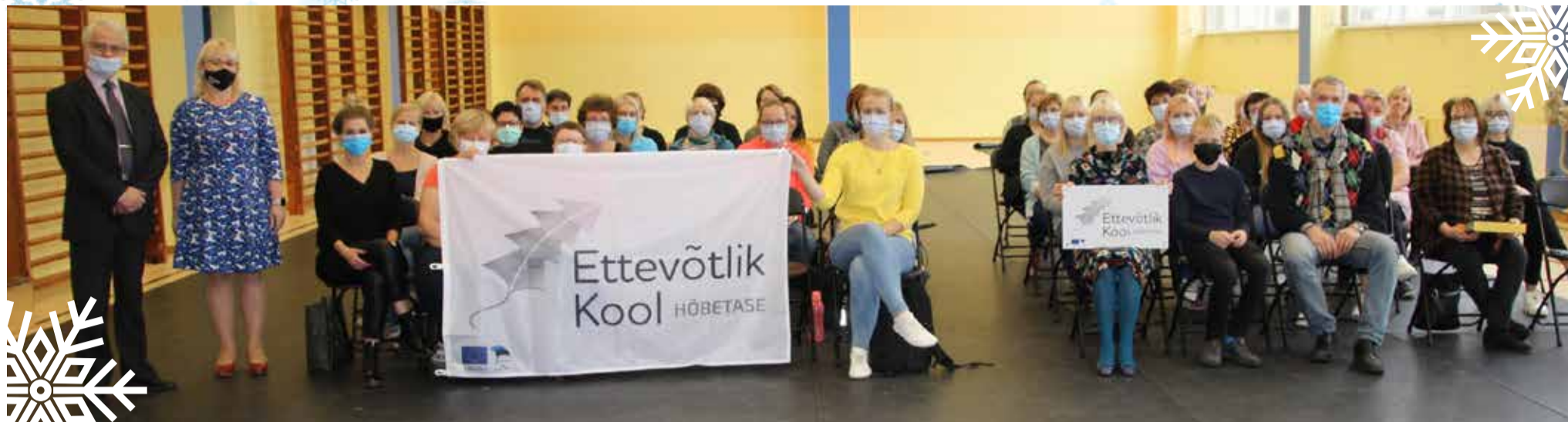
Ettevõtlik Kool omistas tänavu Väike-Maarja Gümnaasiumile teise astme ehk hõbetaseme.