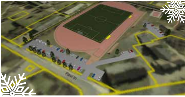
Väike-Maarja staadioni esmane eskiis.