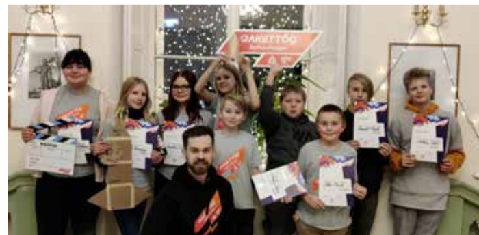
Novembrikuu startis rakett, kuhu mahtus õpilasi 4.–7. klassini.

sel startis rakett, kuhu mahtus õpilasi 4. – 7. klassini. Laagrit tõi Kiltsi kooli ning juhendas õpetaja Tanel Kümnik. Õpilased lahendasid ülesandeid põnevusega, oli näha, et nautisid igat hetke. Lisaks ülesannetele oli