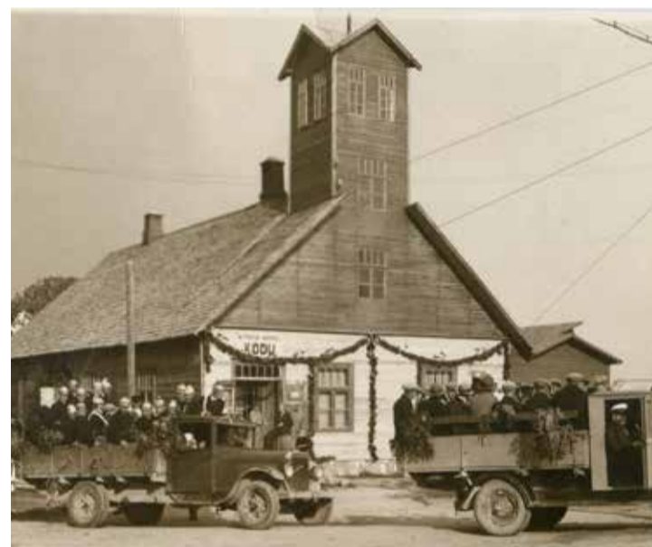
Väike-Maarja Tuletõrjute Kodu pidupäeval, 20. a-d.