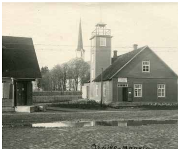
Väike-Maarja vaade, v-lt K. Kihlefeldi raamatupood, tuletõrjemaja (torn küljel). 30. a-d.