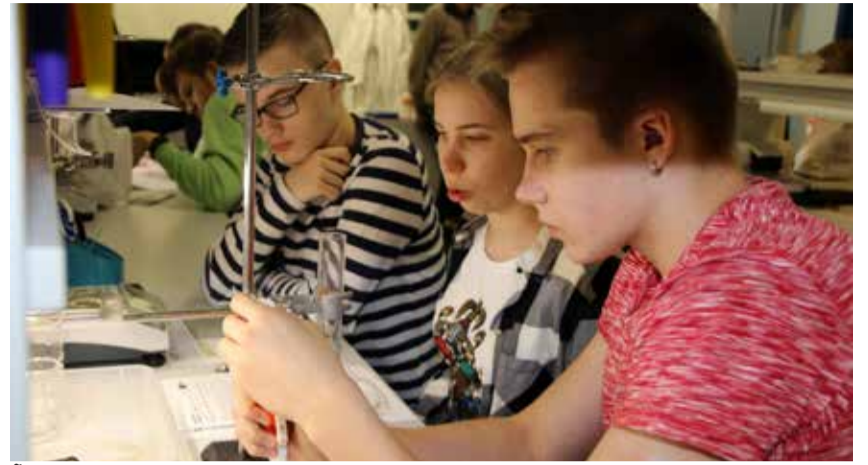
Õpilased Lään-Viru Värkstoas võistlusmelus.

Küsimise hetkeks oli laborivoor põhikooliosas läbitud, millest oli Hellatile jäänud väga hea mulje. Võistluse tulemuste põhjal saadi muidugi paremusjärjestus, kuid žürii jälgis ka koos-