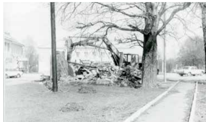
Väike-Maarja vana bussijaama ja avaliku väljakäigu lammutamine 23. aprillil 1993.a.