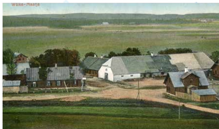
Vaade kiriku tornist: Väike-Maarja keskväljak 1912. a, p-l Jakob Liivi maja.