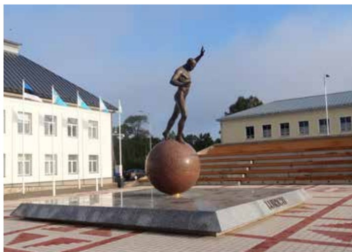
Väike-Maarja uus keskväljak enne avamist 27.08.2018.

Järgnes põhjalik remont ja hoonesse Pikk tn 7 kolis 2002. a aprillis Väike-Maarja vallavalitsus. Samas leidsid koha side, samuti ka mõned firmade kontorid.