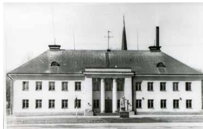
Väike-Maarja Pikk tn 7. Väike-Maarja Kutsekool nr 27 peahoone. Ees väljakul monument „Lahkumine” („Leinav ema”) 1985. a.