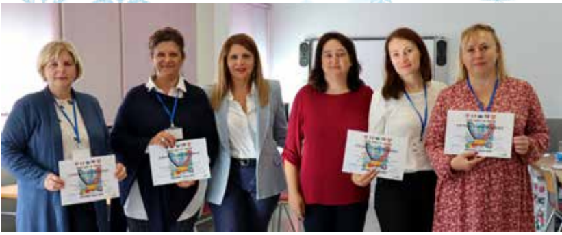
Kohtumisel osalenud Serbia meeskond.