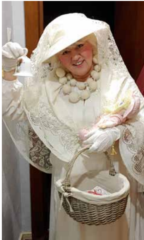
Mare Taar „kadriemana“.

Väike-Maarjas viidi vanasti tangupuder vaagnaga lauta ja pandi kaks lõngakera alla, üks valge ja teine must – siis pidi lammast tooma kaks talle, musta ja valge. Simunas pannakse tänapäeval kartulid kevadel mulda ja loodetakse sügisel sealt võtta punase- ja kollasekoorelisi, et neist siis kadripäeval erinevaid kartuliroogasid valmistada. Veel üks eriline komme oli vanasti, et kadrisant pidi „kusema“. Tavaliselt oli kadri seeliku alla peidetud pudel, kust ta siis vett viskas ja ise hüüdis: „Kadri kuseb!“ Selline tegevus tagas perlele hea kapsakasvu ja tekitas ka palju elevust. „Kadriark“ oli see, kui kadri tõmmati seelikusabad üles ja vaadati, mis värvi püksid kadri jalas on. Kui olid valged, tuli lumerohke talv, kui aga tumedad, siis