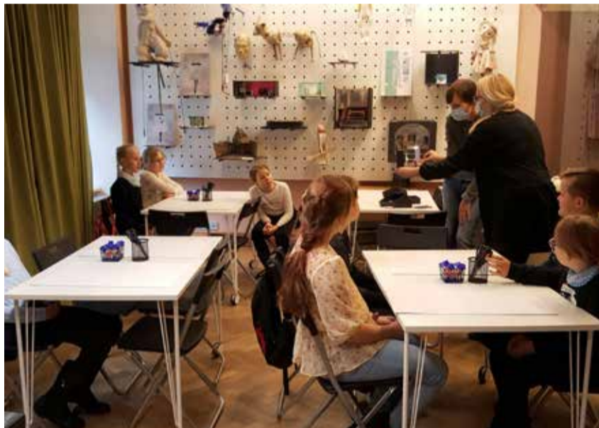
3. klass Tallinnas.