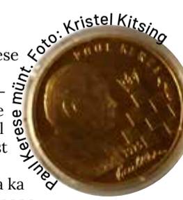
Paul Kerese münd.