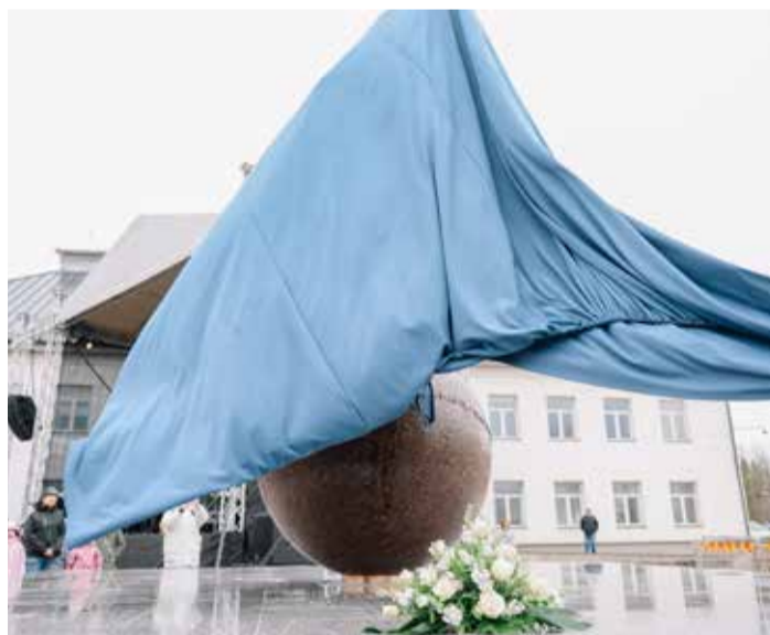
Täpselt maadluslegendi 142. sünnipäeval ehk 22. aprillil 2018 langes kate kahe ja poole meetri kõrguselt pronksist Lurichi monumentilt.