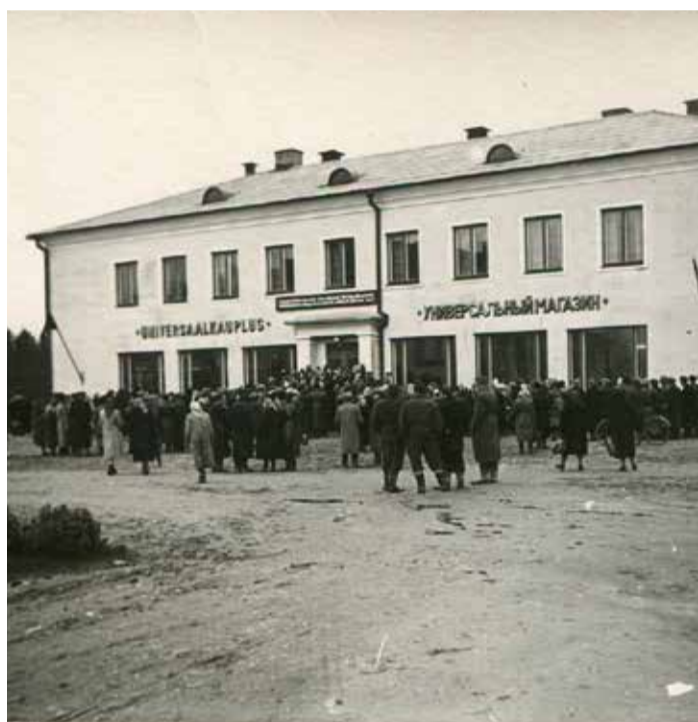
Väike-Maarja Tarbijate Kooperatiivi hooned (Pikk tn 9) kaupluse avamise päev.