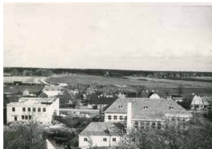
Väike-Maarja hoonete Pikk tn 7 ja 9 ehitamine.