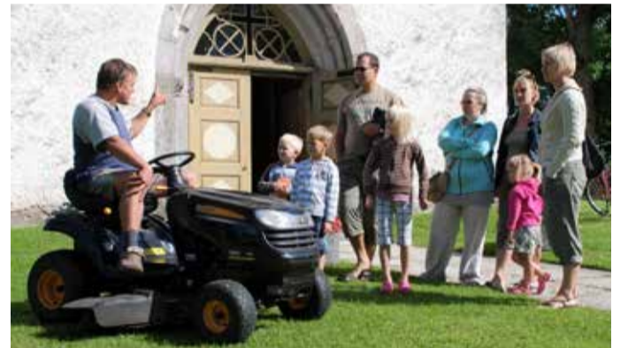
Kogukondade eestvedajad saavad stipendiumi taotlema.