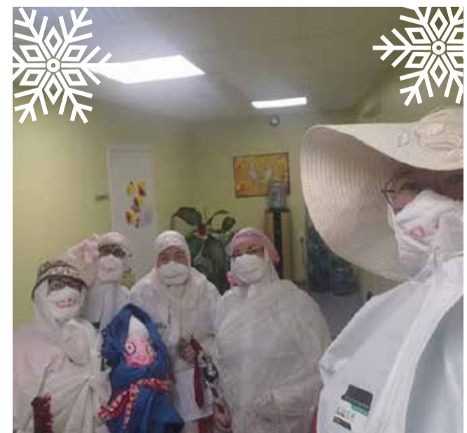
Kadripäeval lauldi ja lahendati mõistatusi.

Sirje Bammer Väike-Maarja hooldekodu juhataja