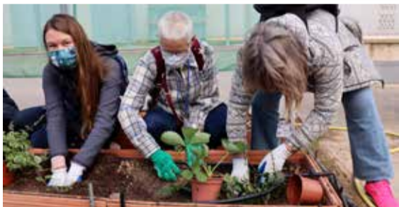
Istutame kasvuhoonesse maasikaid.