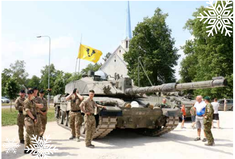
Maakondlik maakaitsepäev toimus tänavu Väike-Maarjas.

iseseisvuspäeval kodukohvikute päev. Eelmise päeva ilm kustutas küll kõik lootused selle päeva õnnestumiseks, aga ennäe imet, kell 10 hommikul sadas Väike-Maarjas lühikese aja maha tohutu hulk vett ja siis ilmus pilvede vahelt lootuskiir. Kell 13 esines kirikus isamaaliste lauludega kaunikõlaline segakoor ja nii esinejad kui publik olid tunnistajaks pühakoja imelisest akustikast. Poetasime väikese pisaragi ja asusime taas kohviku-