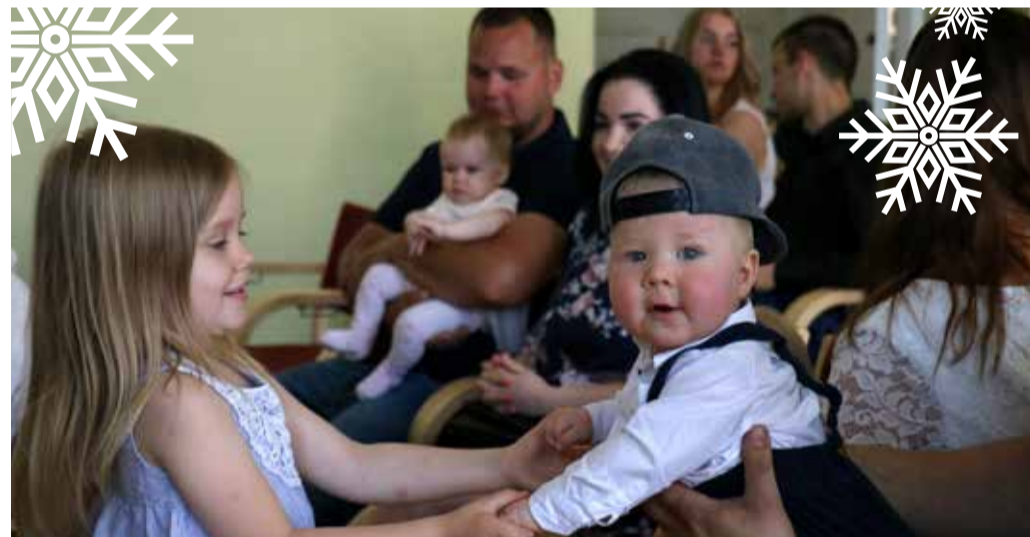
Igal aastal tervitatakse uusi ilmakodanikke ja nende vanemaid vastuvõtuga.

Tütarlastele pandud eesnimed: Aliise, Crislyn, Eileen, Flo, Gertu, Iris, Kene, Kethi-Loreen, Klara, Liand-