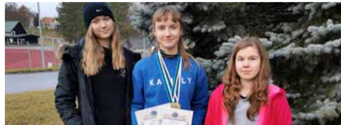
Noorlaskurid Põlvas.

Hea on öelda, aga katsu teha. Algus oli ikkagi väga rabe. Pärast esimesi laske näitas suvi monitor alles 14. kohta. Publik saab istuda ja vaadata laskurite tule-