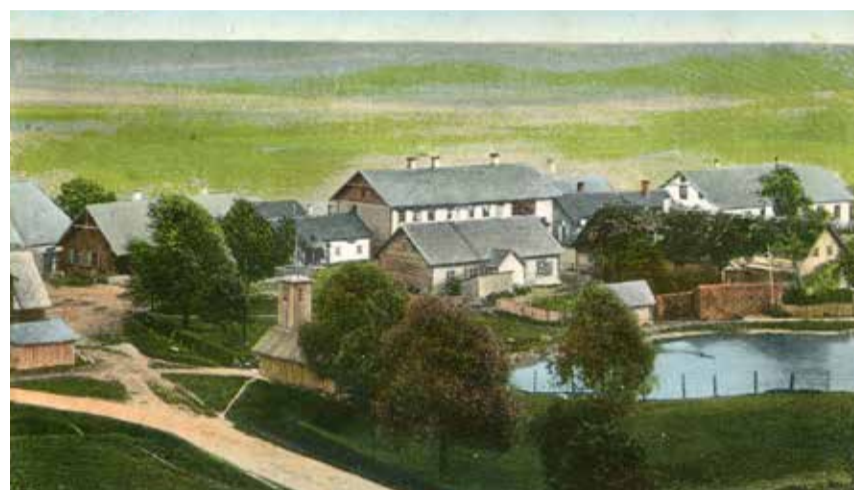
Väike-Maarja aleviku vaade 1912. a. Keskel puude varjus pritsikuur.