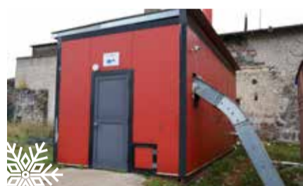
Soojakao vähendamise eesmärgil ehitati ümber Triigi katlamaja.

Kaire Kislov Väike-Maarja Haldusteenused juhataja