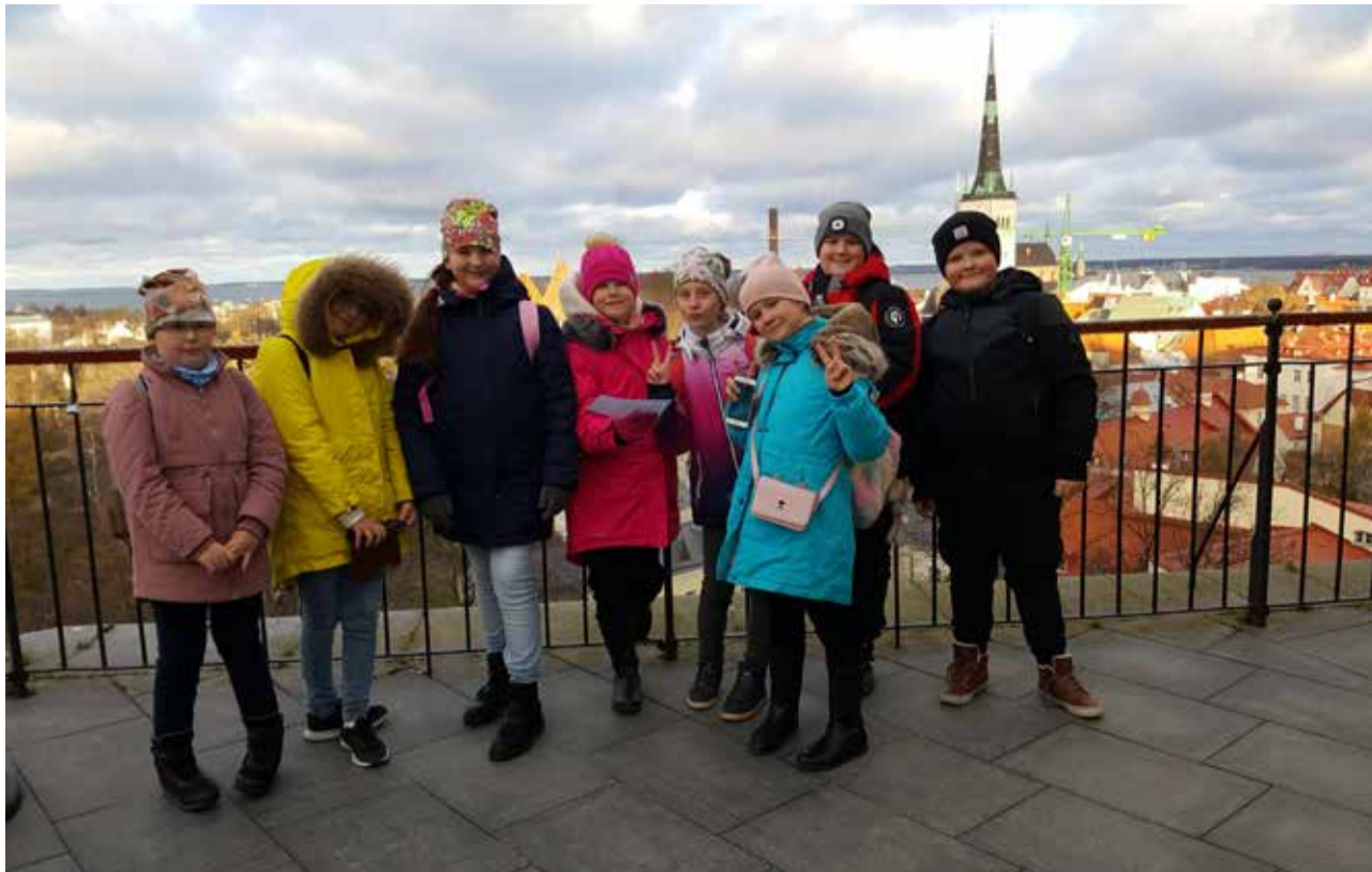
3. klass Tallinnas.