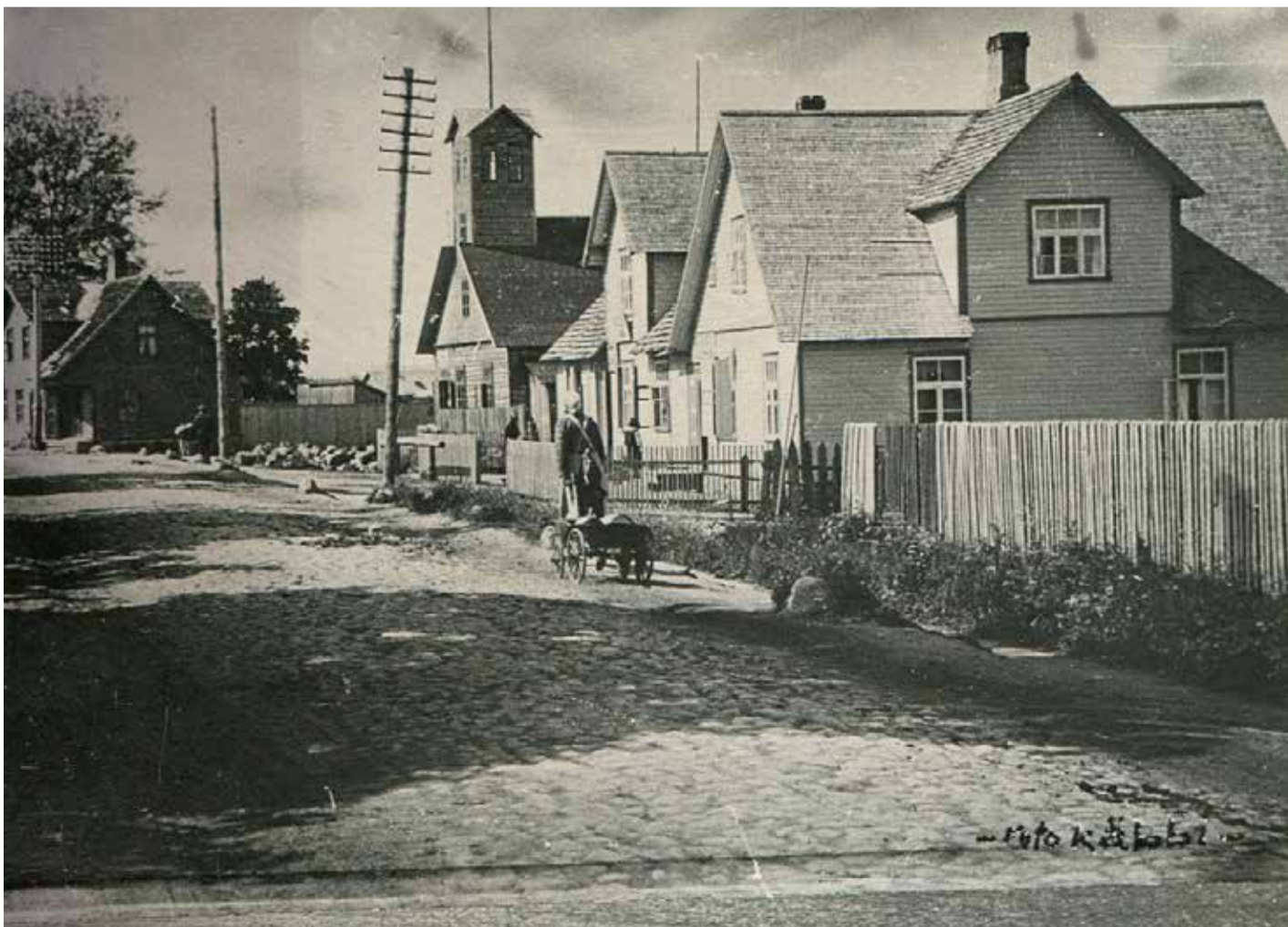
Väike-Maarja Pikk tänav, p-lt Kase maja, tuletõrjemaja, Liivi-Kihlenfeldi maja. 20. a-d.