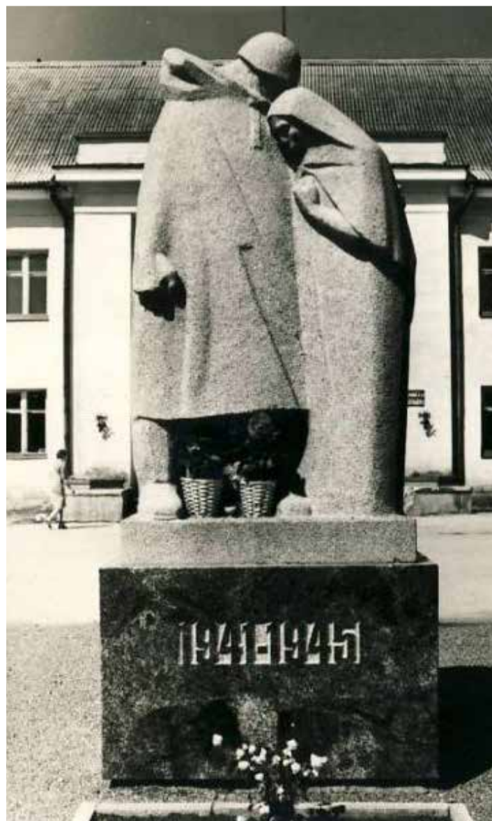
Kalju Reiteli monumentaal-skulptuur „Lahkumine” Väike-Maarja keskväljakul.