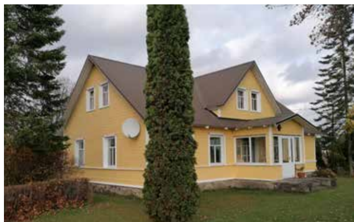
Värvivärskenduse saanud elumaja Avanduse külas.