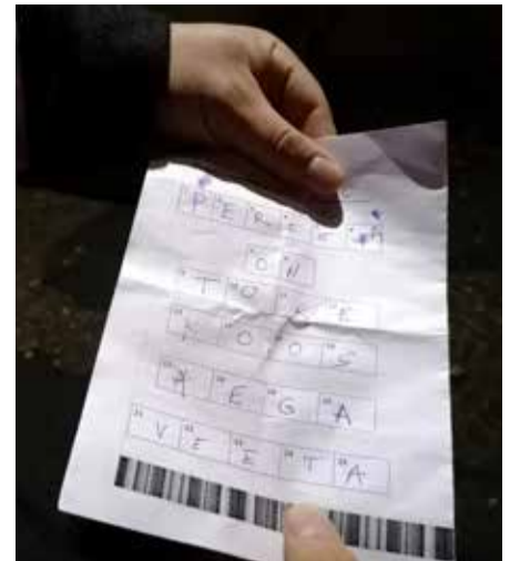
Pereorienteerumise eesmärgiks oli lisaks liikumisele otsida Väike-Maarja alevikku peidetud tähti ja neist kokku panna lause.

Väike-Maarja gümnaasiumi tõi pered õue ühiselt liikuma, kui isadepäeva tähistati tänava pereorienteerumisega. Väike-Maarja alevikus kulgevale rajale oli peidetud lahendus-lause, mis tuli tähthaaval kokku panna. Selle lihtsustamiseks oli tähtede juures ära näidatud ka nende järjekord lauses. Tähed olid peidetud nelja piirkonda – gümnaasiumi peamaja ümbrusesse, Liivi parki, Wiedemanni keeletammikusse ja algklasside maja juurde. Et usinatel otsijatel pimeduses suurt segadust ei tekiks ning rajale päevadeks või nädalateks ekslema ei jäädaks, olid lahendustulbad keemiliste tuledega valgustatud. Nii ei jäänudki muud üle, kui ühe „jaaniussi“ juurest teise juurde kulgeda ning õiged tähed koolist saadud kutsele kirja panna.