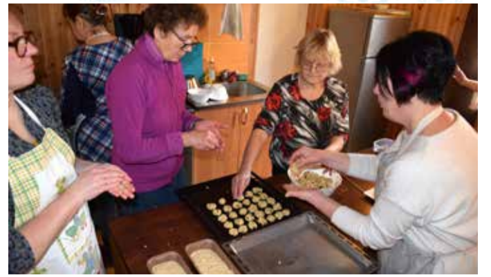
Kadripäeva eel valmisid Eipri külamajas talleribi odrakruupidega, kaerakäkid ja karask.