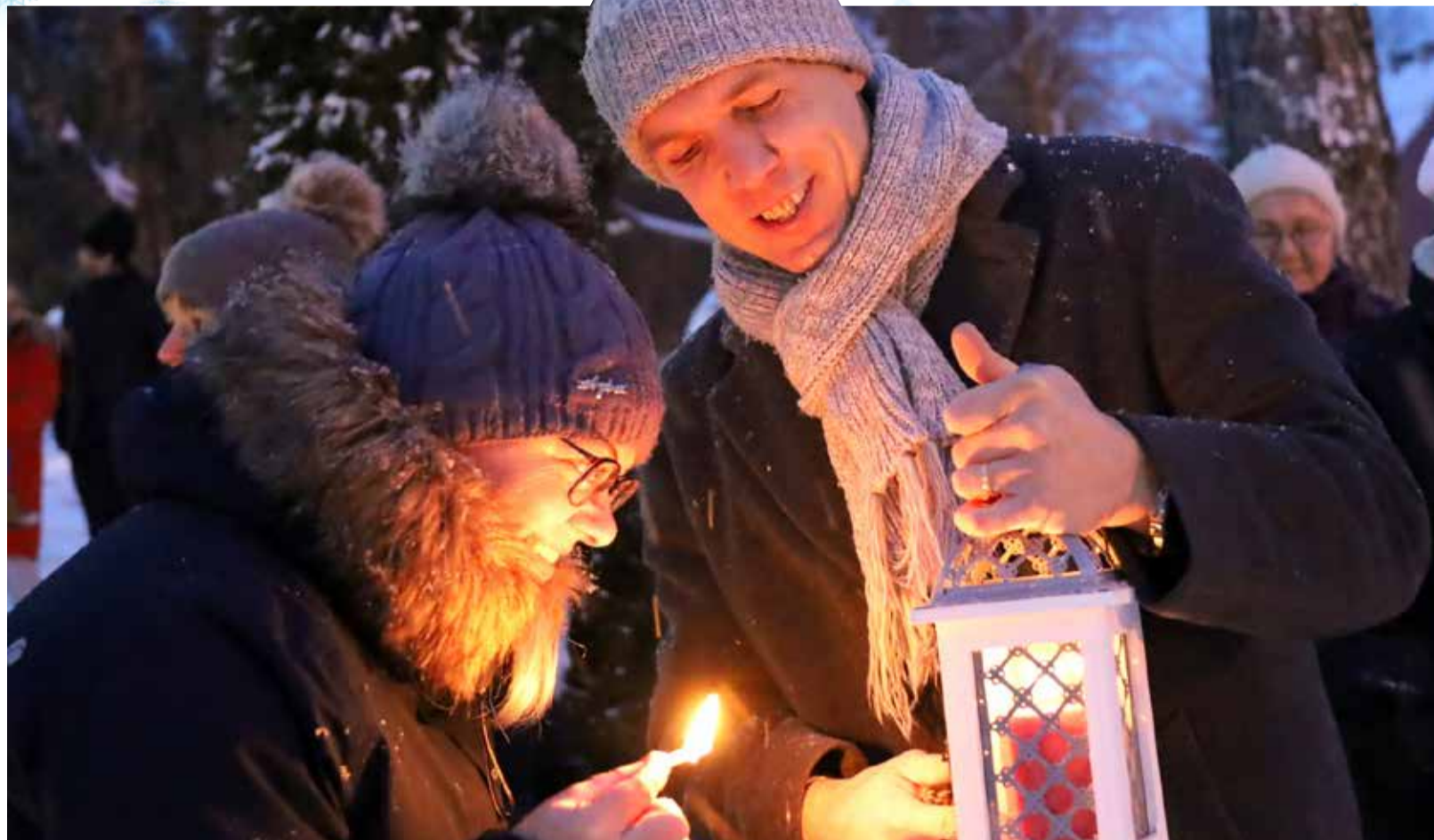
Rakke, Simunas ja Väike-Maarjas säravad alates 1. detsembrist tuledes jõulupuud. Advendiaeg on olnud alati seotud jõuluootuse ja imedega. Laste jaoks tähendab see, et päkapikud hakkavad käima ja sussi sisse kingitusi tooma. Täiskasvanud teevad juba plaane jõuludeks.

Väike-Maarja Vallavalitsus kingib valla lasterikastele peredele (kolm ja enam last peres) ning puuetega lastega peredele jõuludeks kinkekaardi, mille saab kätte 13.12.2021–31.01.2022 vallamajast (Pikk tn 7, Väike-Maarja, kabinetti 102). Lisainfo lastekaitse spetsialist Tiia Kaselo, tel 329 5762.