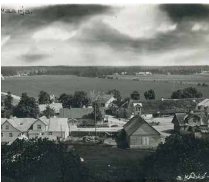
Vaade Väike-Maarja keskosale. Ees v-l Vakmani-Kase maja, ees keskel pritsimaja, p-l Liivi-Kichlefeldi raamatupoe maja.