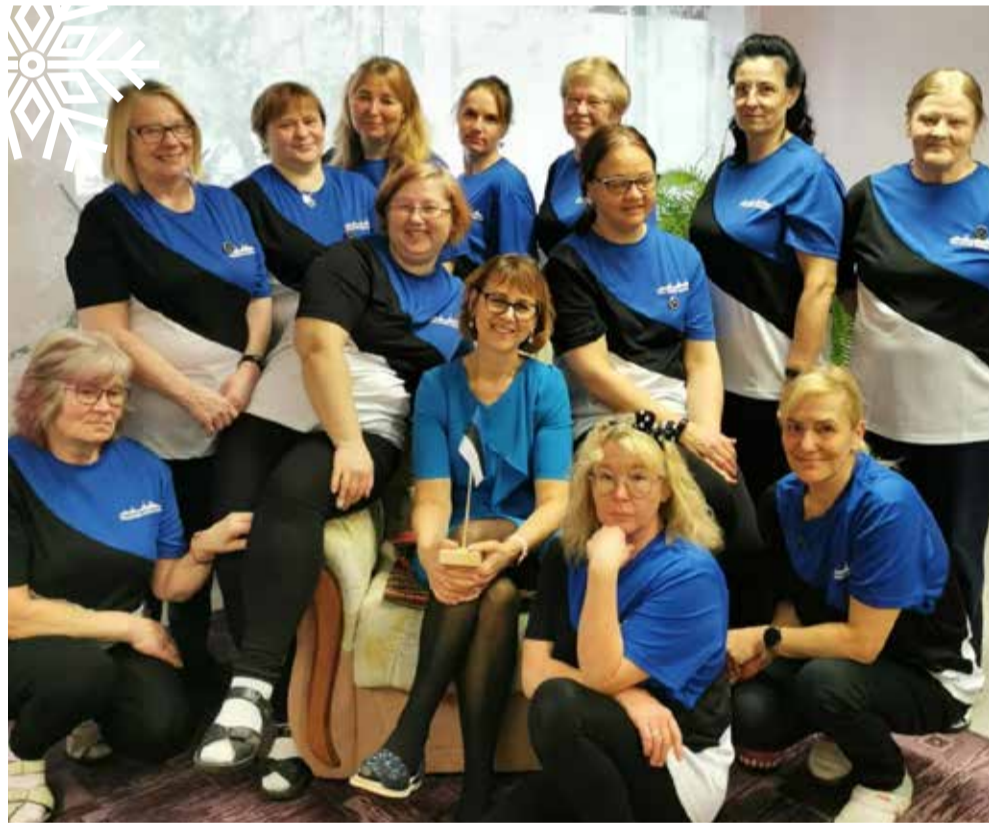
Hooldekodu personal kodumaa sünnipäeval.

Ootamatult jõudis kätte jaanipäev. Külla oli kutsutud mängima klienti poeg oma sõpradega: lauldi ja tantsiti