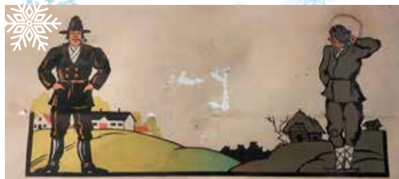
Penn penni kõrvale, mark marga | Mark ees või teine taga, hukka juurde, — nii kasvab jõukus. | Mark ees või teine taga, hukka nüüd iga penni lugema!