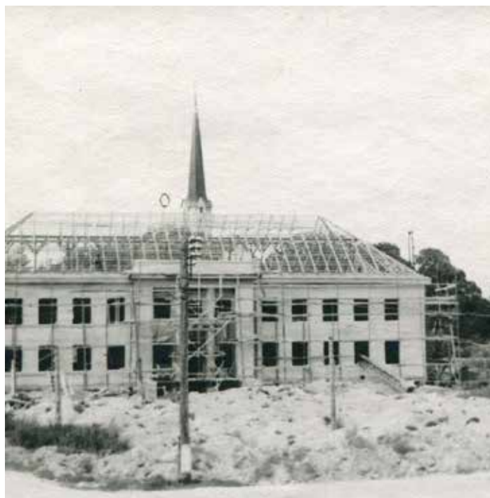
Väike-Maarja Pikk tn 7. Väike-Maarja rajooni administratiivhoone ehitamine 1956-1957. a.

1962. a Väike-Maarja rajoon likvideeriti, piirkond ühendati Rakvere rajooniga. Väike-Maarjasse asutati Maakutsekool nr 27 elektrike, hiljem maaparandus-mehhanisaatorite ettevalmistamiseks. 1. septembrist 1975 kandis kool nime Väike-Maarja Kutsekool nr 27, 1991 a-st Väike-Maarja Põllutöökool. 1993. a võeti kooli vastu esimene grupp tuletõrjujaid-päästjaid. 1995. a sai põllutöökool õppekeskuseks, päästekool eraldus iseseisvaks õppeasutuseks. Kool lahkus oma peahoonest lõplikult 1999. a-ks.