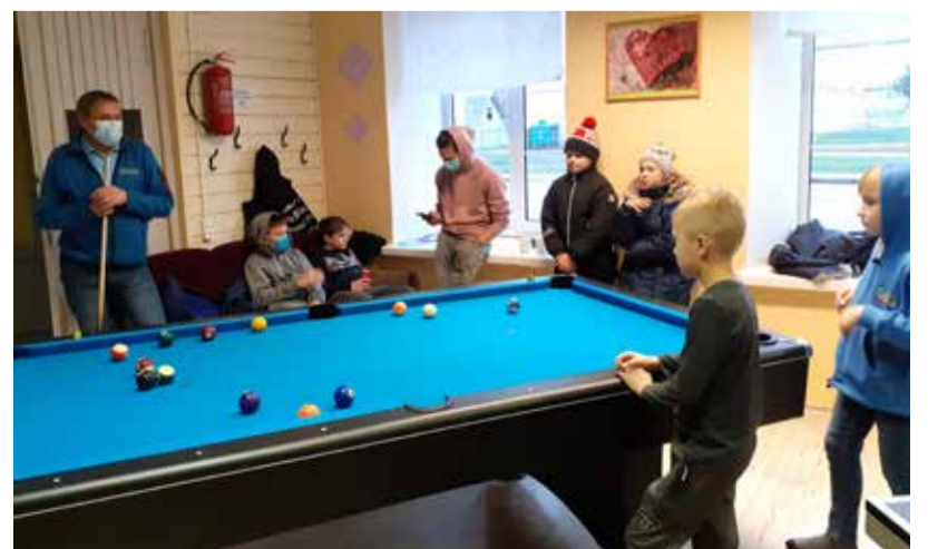
Rakke noortekeskuses on nüüd kauaigatsetud uus ja suurem piljardilaud.