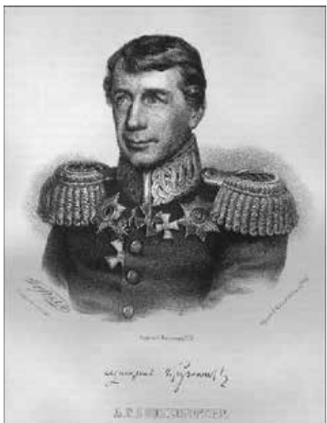
Ühte näituse osasse on koondatud Ivan Fjodorovitš Krusensterni mälestusesemed. Nende hulgas äratab erilist huvi raamatute